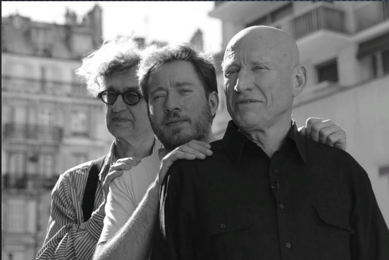
Вим Вендерс, Жулиану Салгаду и Себастьян Салгаду