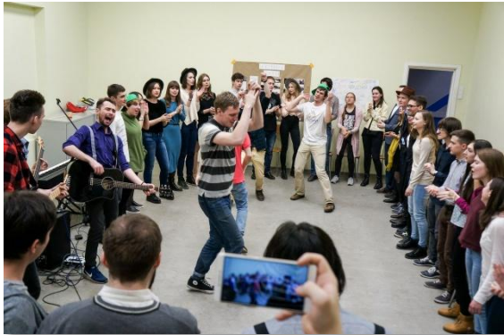
5 лет ЖЗ «5 котлет»