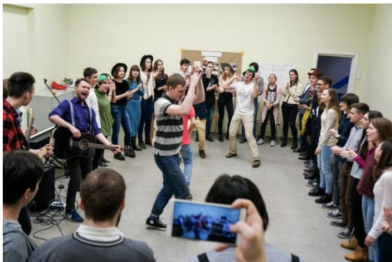
5 лет ЖЗ «5 котлет»