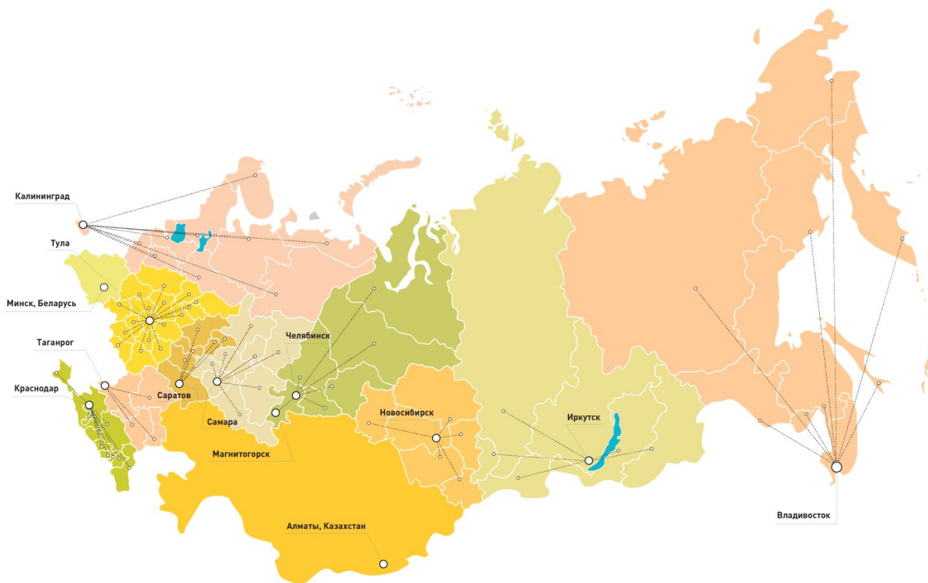
ГРАФИК СТАРТАП ТУРА 2016