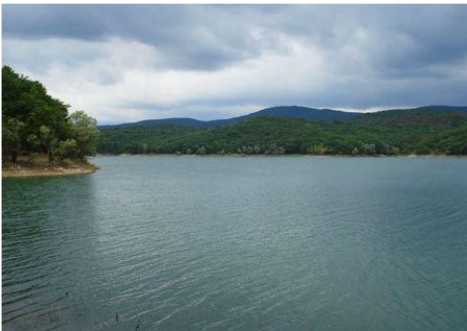
Партизанское водохранилище, Крым