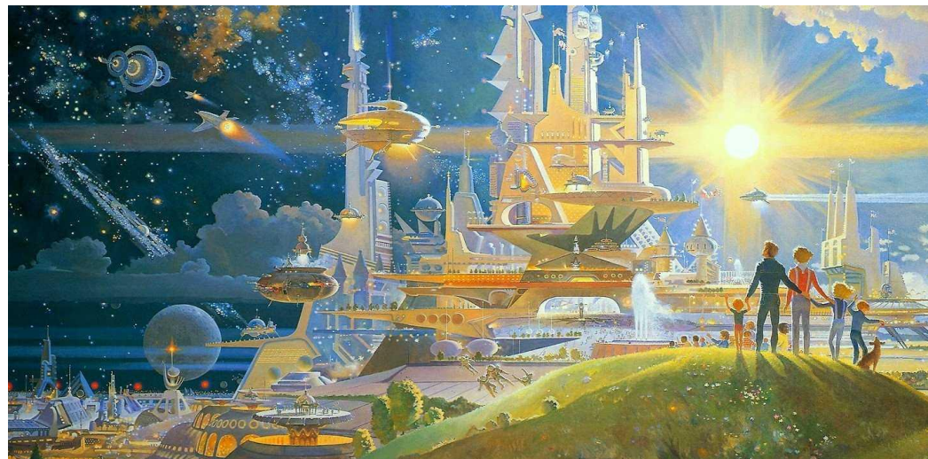
«Мир, если 85+25 равнялось бы 100 », худ. неизвестен