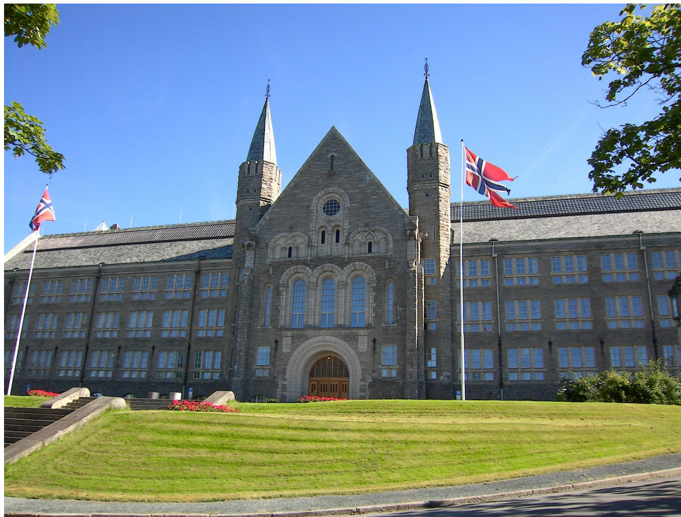
Междисциплинарный Центр педагогического образования Университета Агдер (норв. Universitetet i Agder)