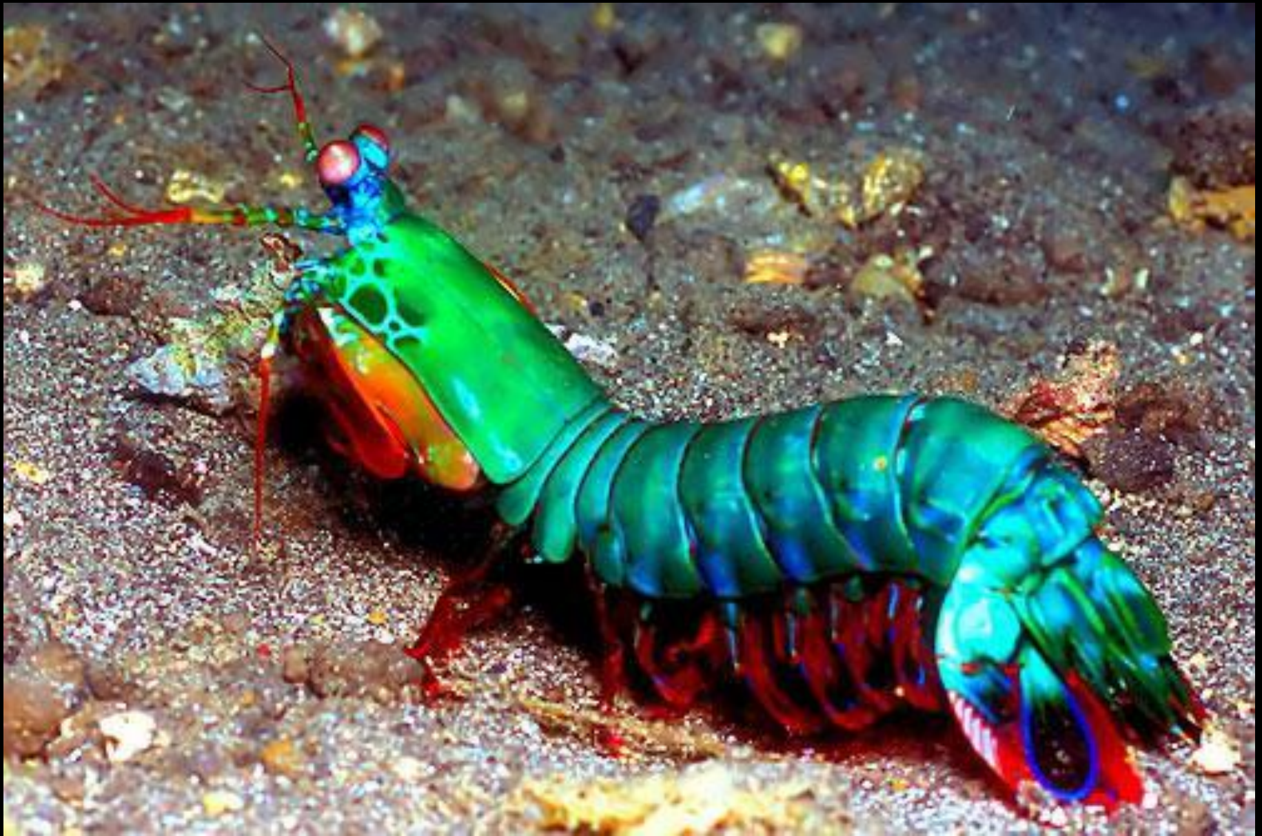
The Mantis Schrimp (La crevette mante-religieuse)