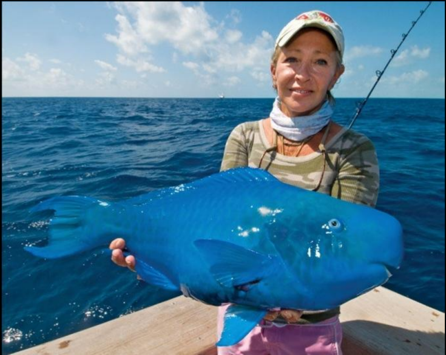
The Blue Parrotfish (Le poisson perroquet bleu)