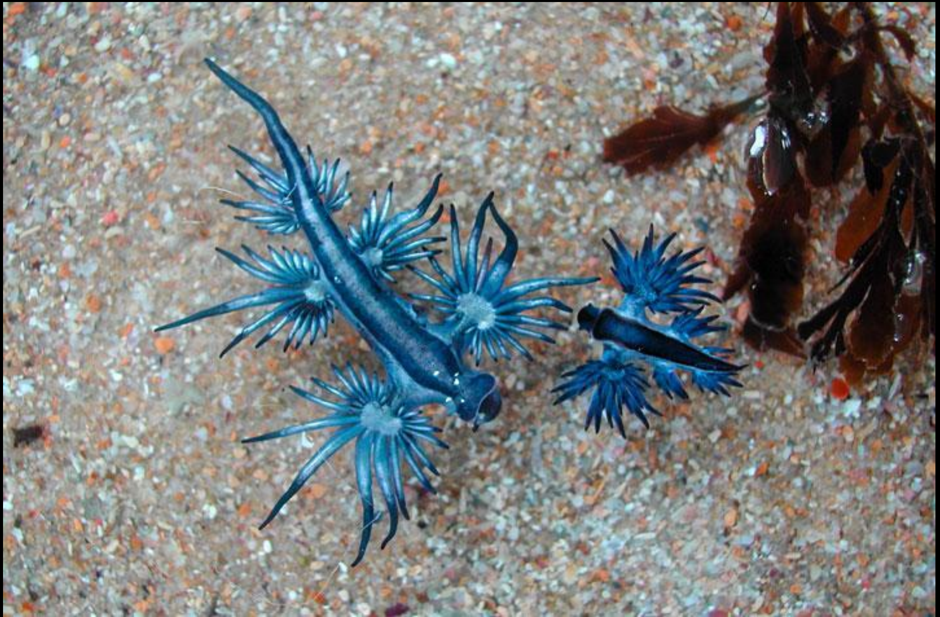
Le Glaucus Atlanticus (Le dragon bleu)