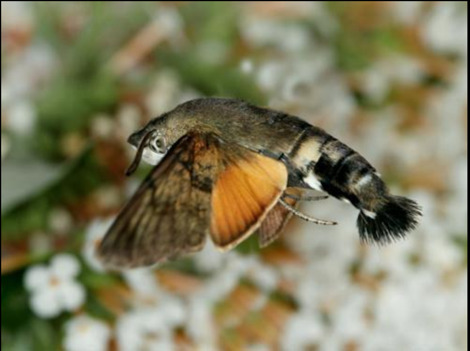
The Hummingbird Hawk-Moth ( Le sphinx colibri )