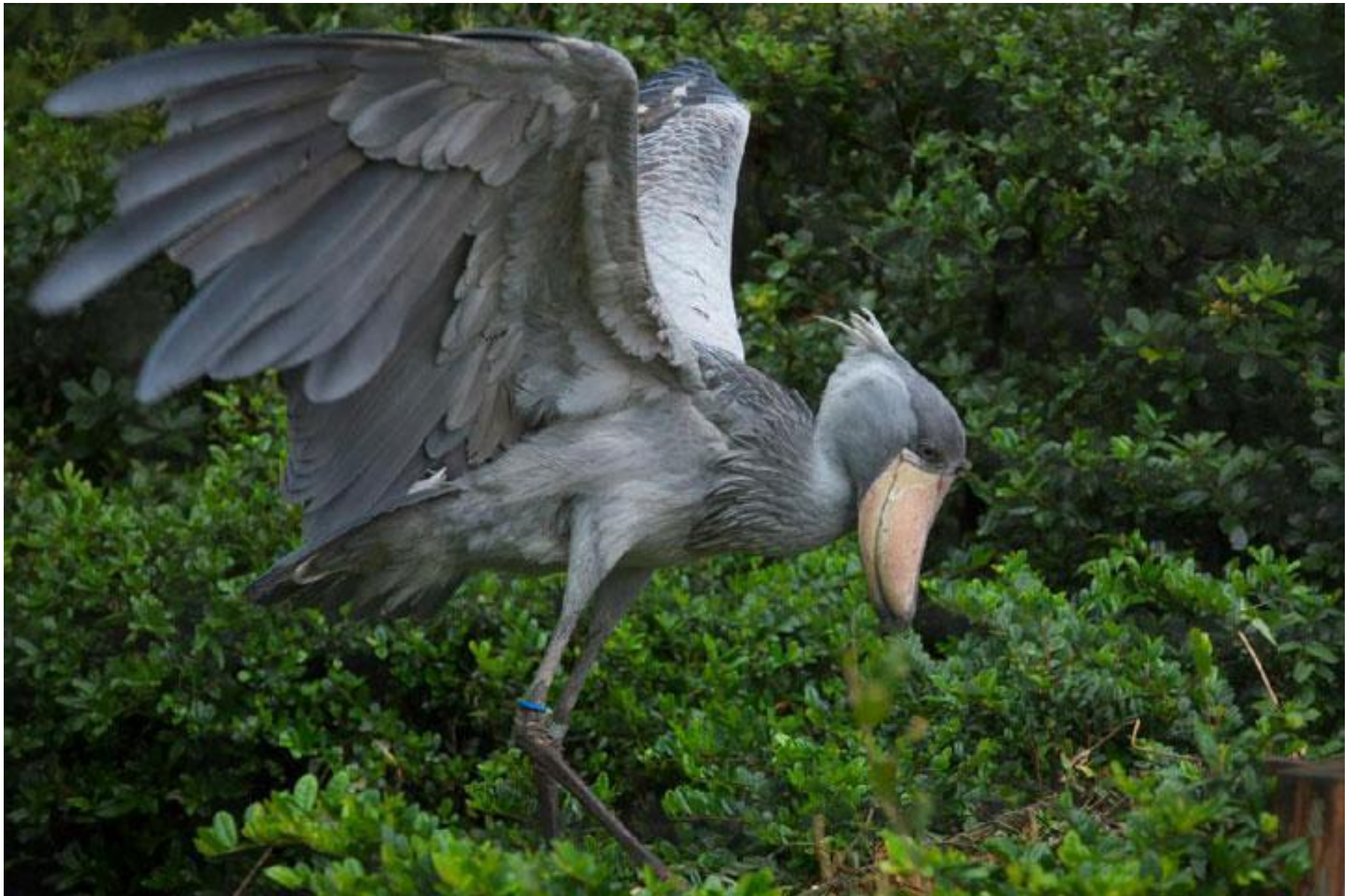
The Shoebill (Le bec-en-sabot du Nil)