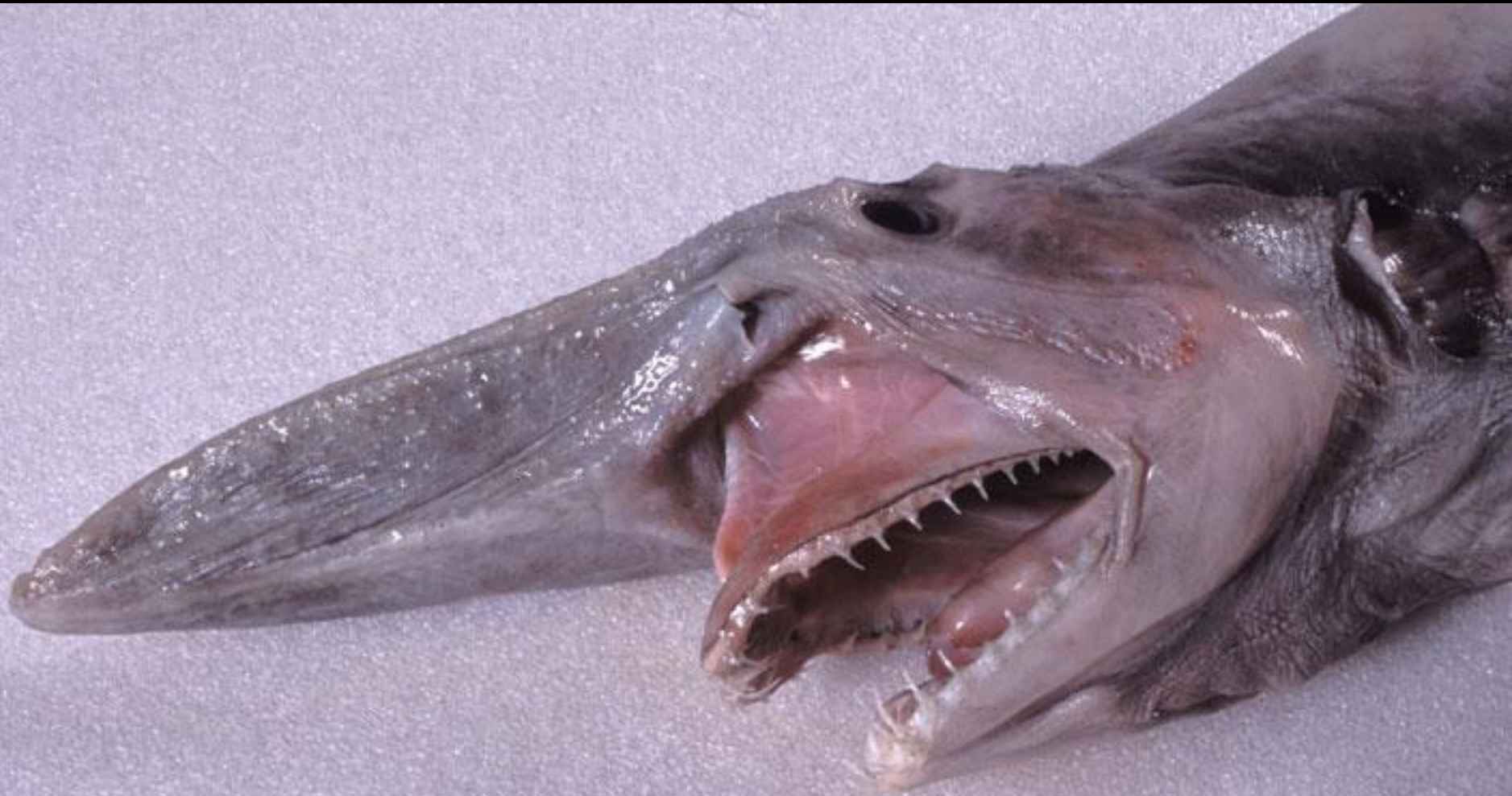
The Goblin Shark (Le requin lutin)