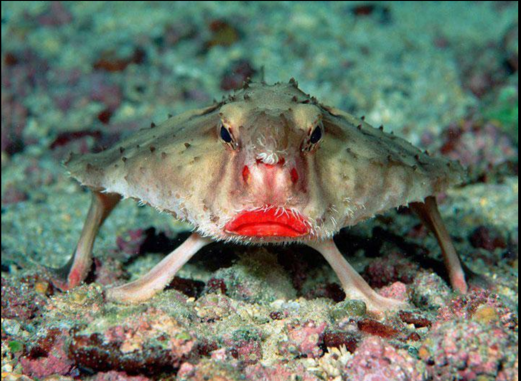
Le Red-lipped Batfish (Le poisson chauve-souris option rouge à lèvres)