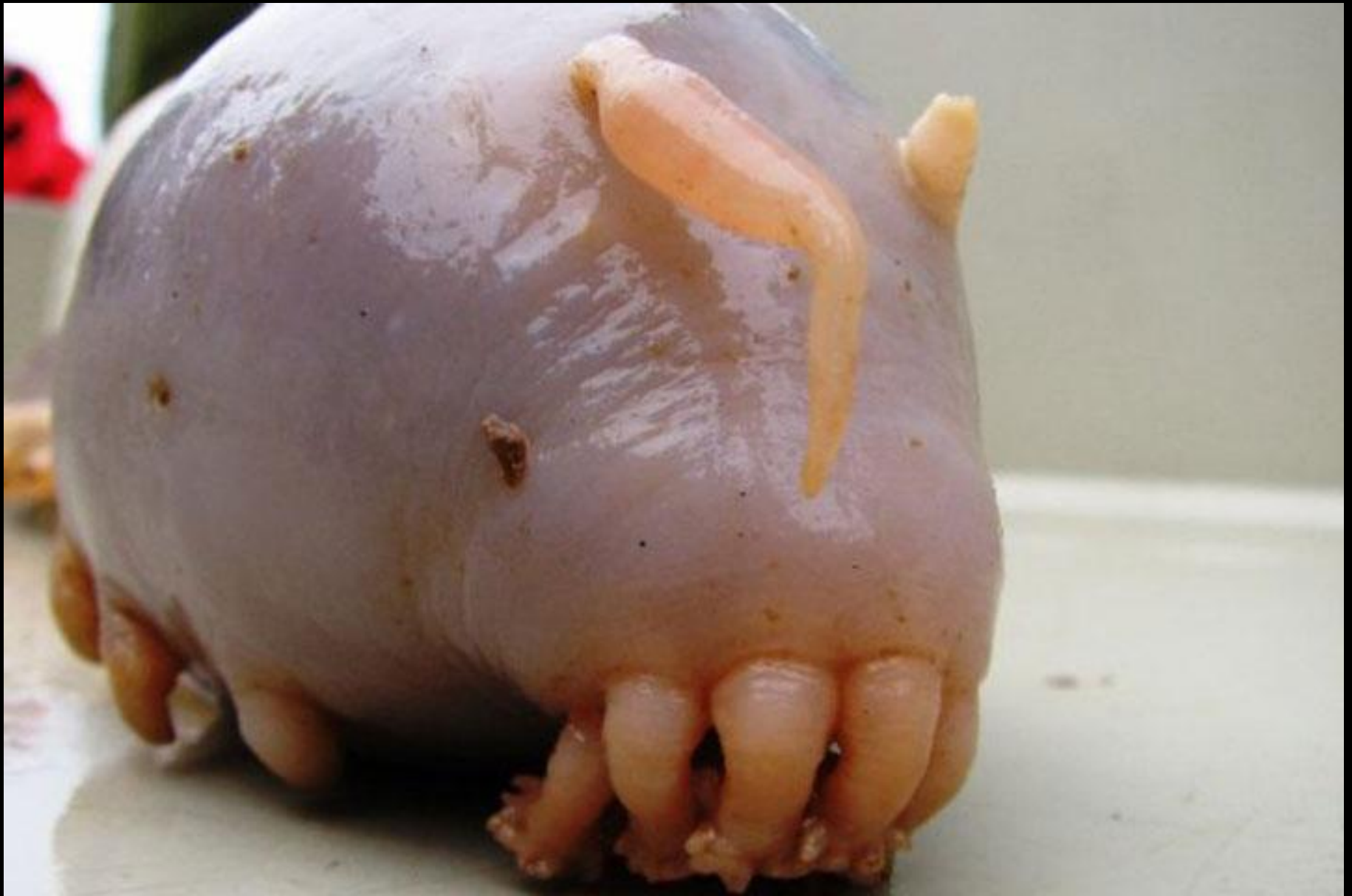
The Sea Pig (Le cochon de mer)