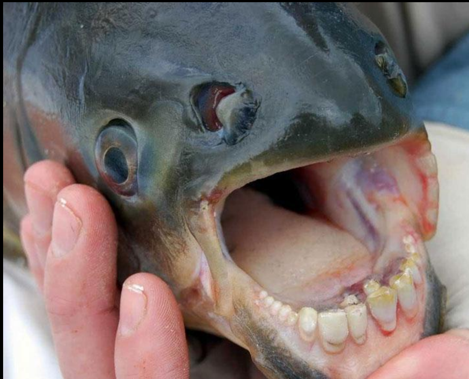
The Pacu Fish (Le poisson Pacu)