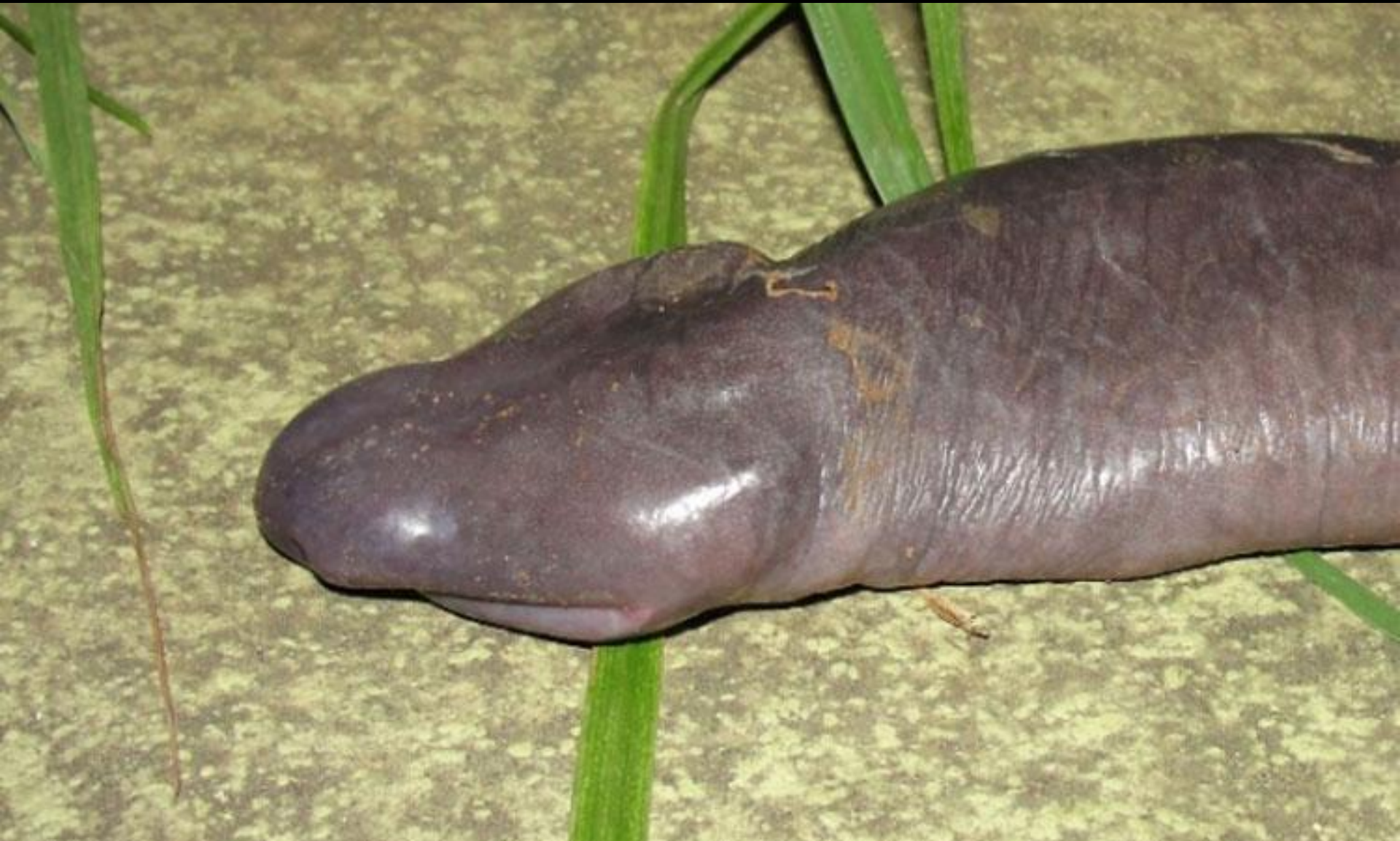
The Penis Snake (Le serpent pénis...)