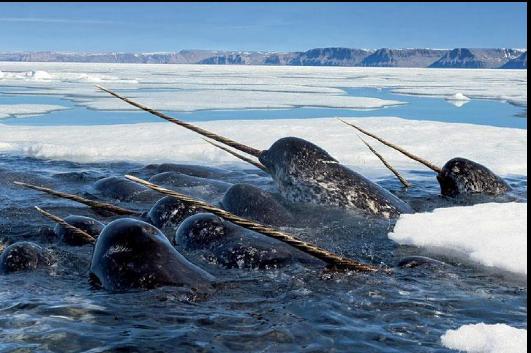
Le narval ou licorne des mers