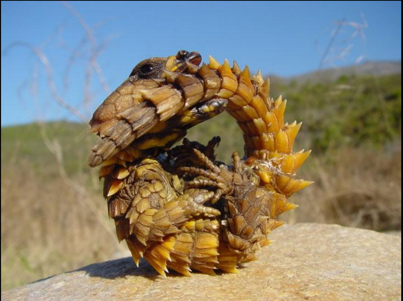
The Thorny Dragon (Le moloch)