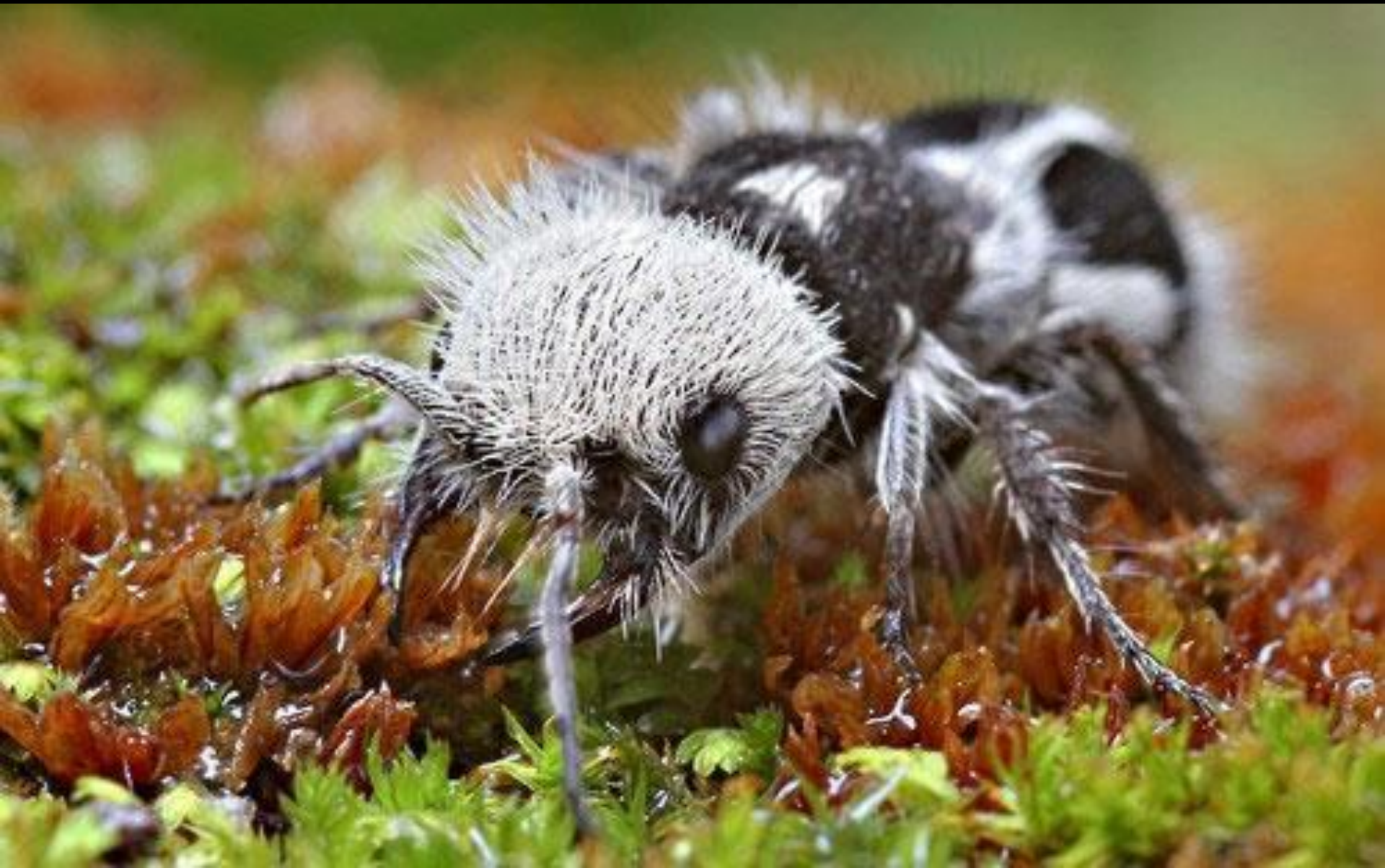
The Panda Ant (La fourmi panda)