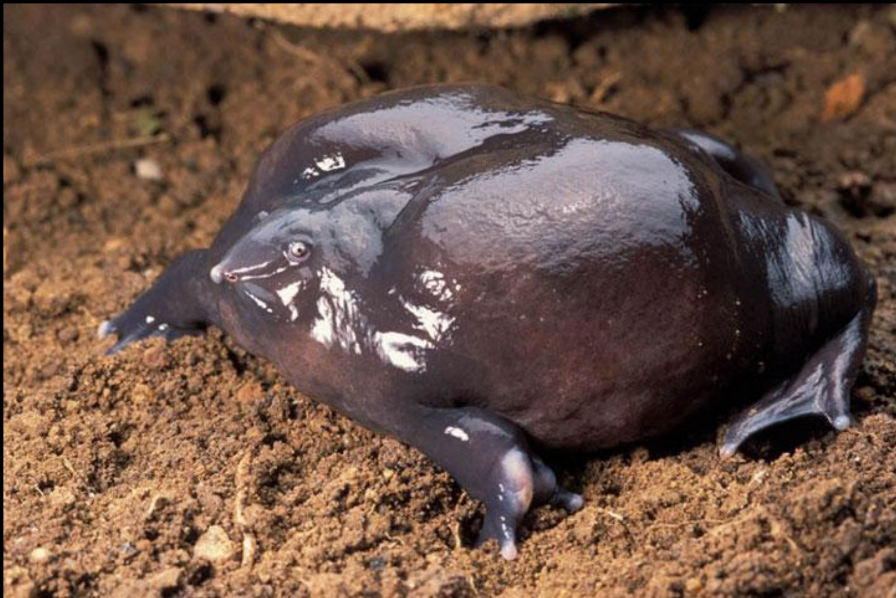
The Indian Purple Frog (La grenouille violette d'Inde)