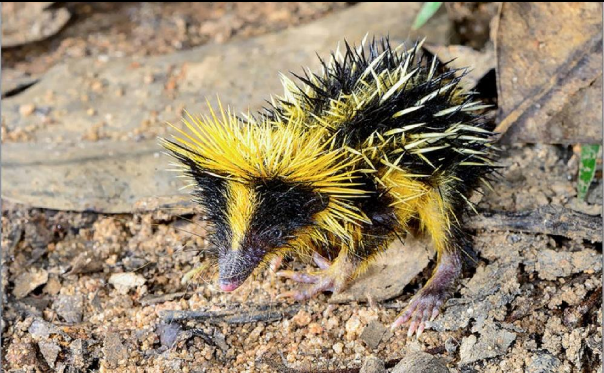
The Lowland Streaked Tenrec (Le tenrec strié)