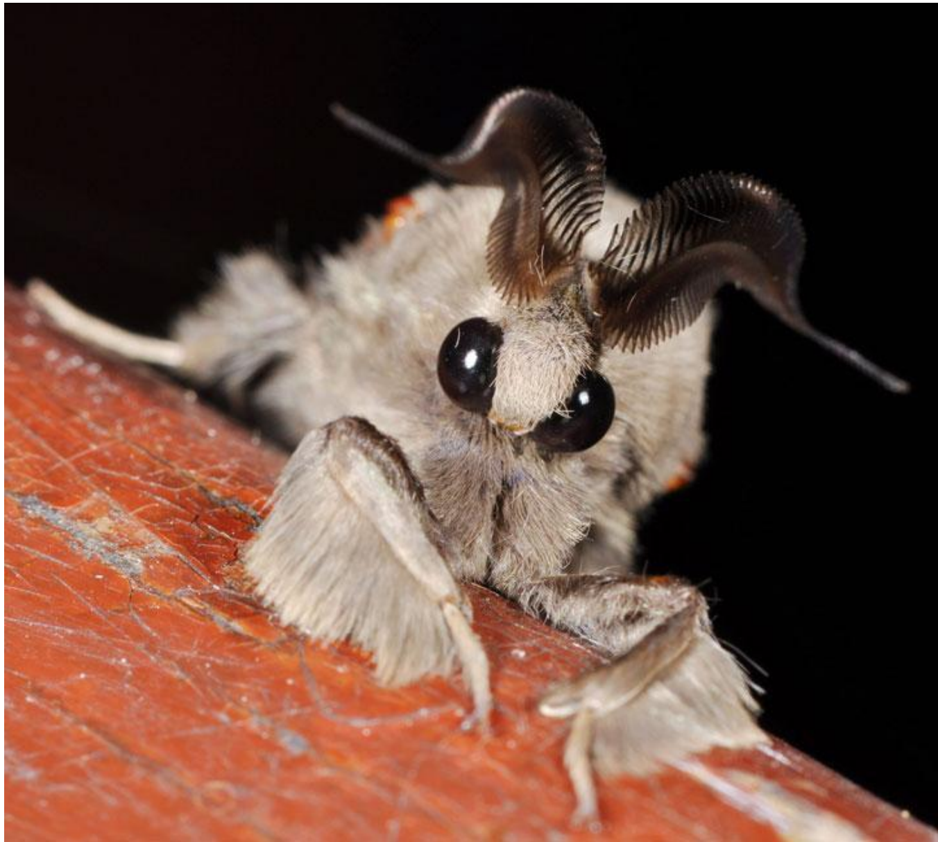
The Venezuelan Poodle Moth (Le papillon caniche du Venezuela)