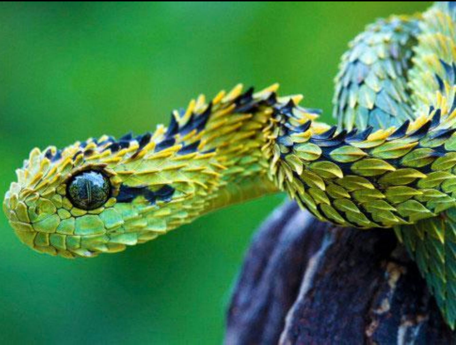
The Bush Viper (La vipère des buissons)