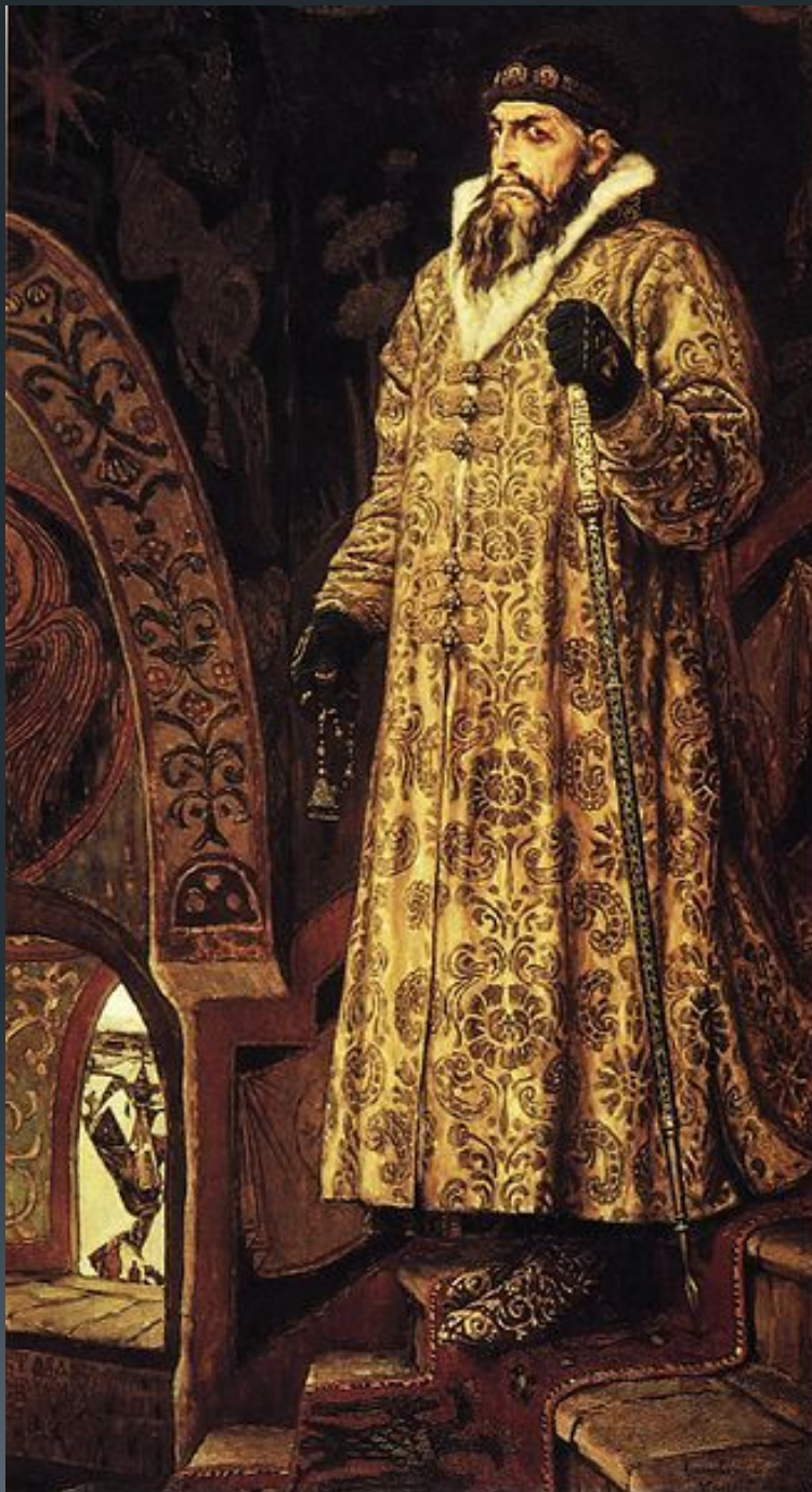
В. М. Васнецов Царь Иван Грозный, 1897