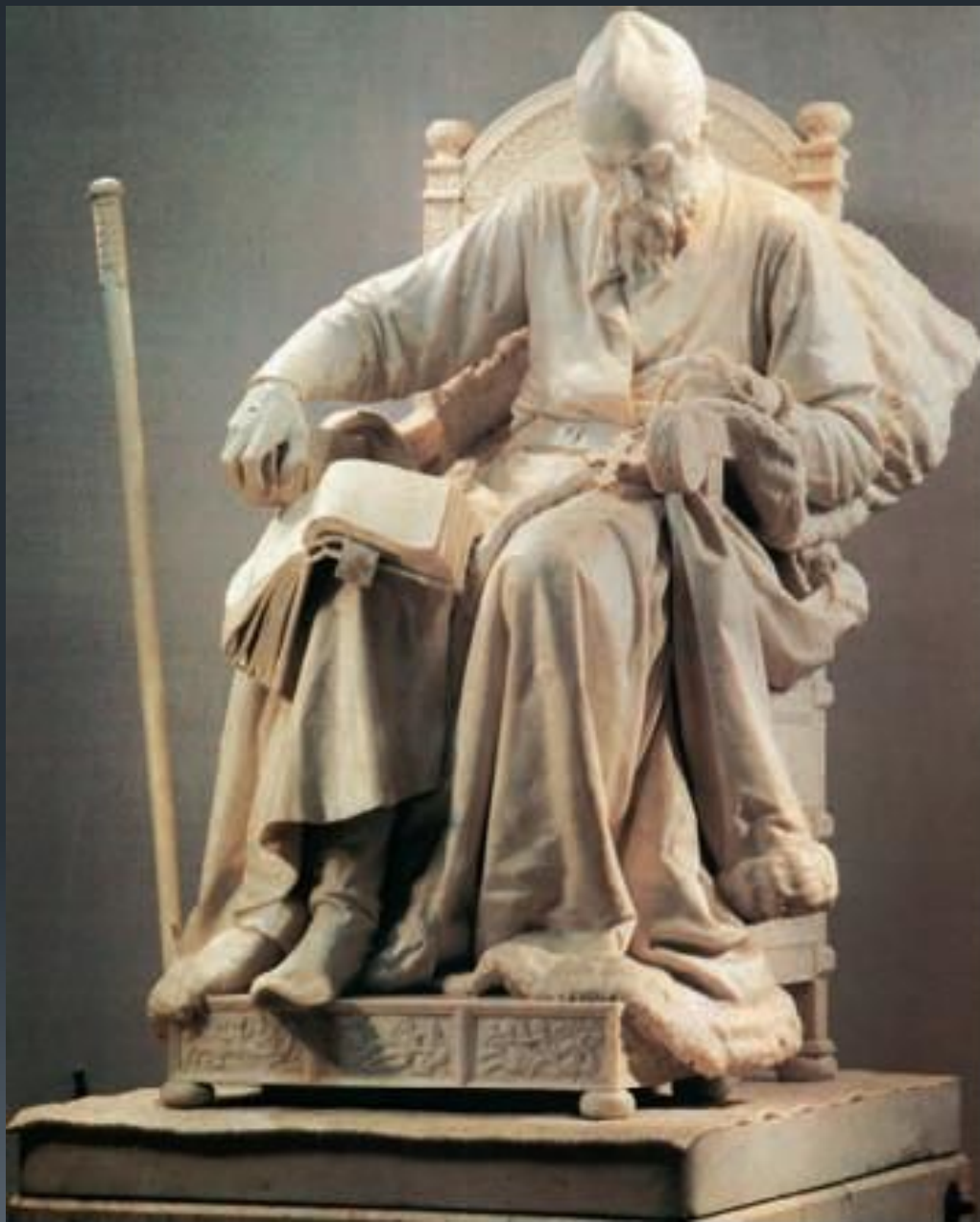
М. Антокольский. Статуя Иоанна Грозного 1871г.