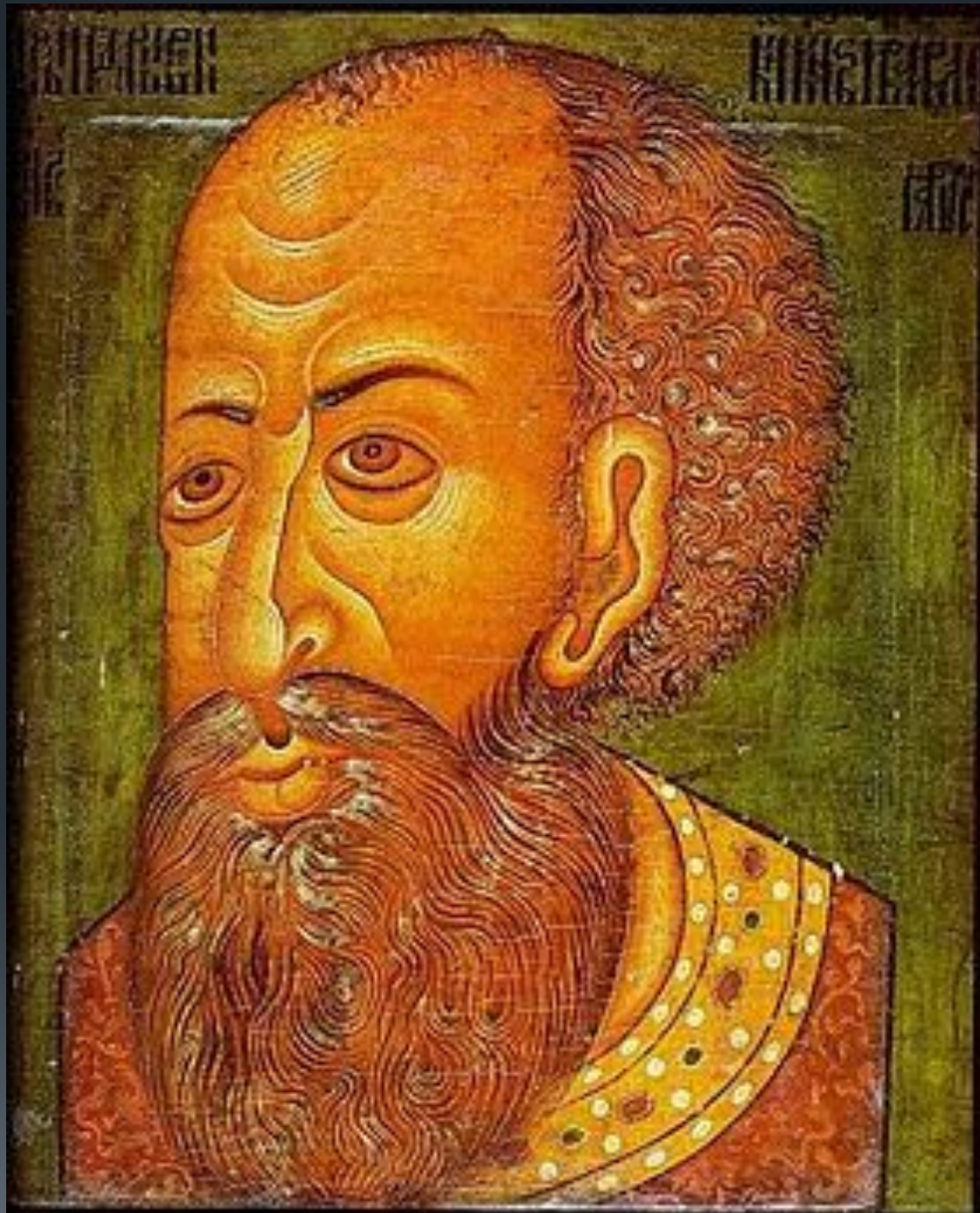
Парсуна Ивана IV Грозного из собрания Национального музея Дании (Копенгаген), к. XVI-нач. XVII вв.