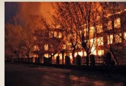
После школы после бомбежки

Население поселка и работников завода обычно уходило в бомбоубежища за исполнением ответственных обязанностей персонала в непосредственно действующих цехах