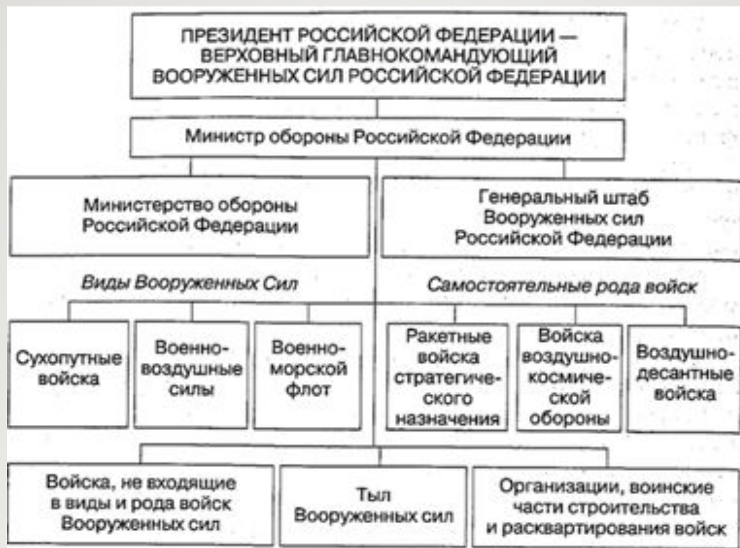
Рис. 1.1. Структура Вооруженных Сил Российской Федерации