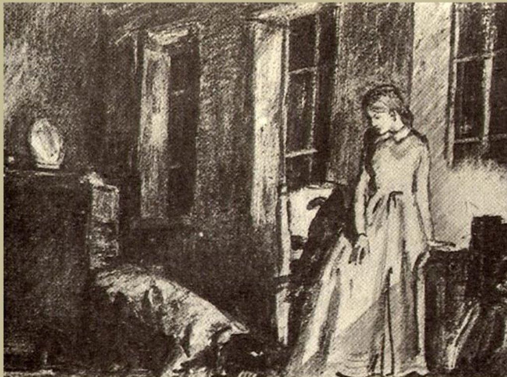
Часть 4, глава 4. Раскольников у Сони. Художник Д. Щемаринов