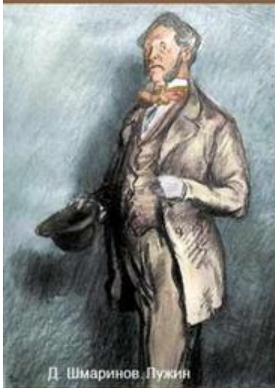
Д. Шмаринов. Лужин

Персонажи, в которых проявляются крайне негативные черты характера главного героя. Проекция теории Раскольникова на жизненные позиции, сниженные и опошленные варианты теории.