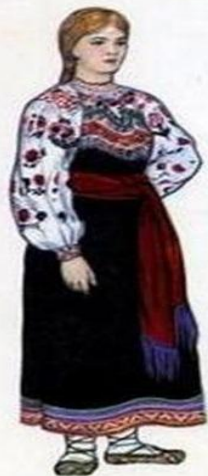
Костюм девушки Курской губернии