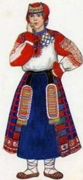
Костюм девушки Воронежской губернии