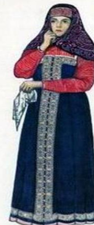
Женский костюм Ярославской губернии