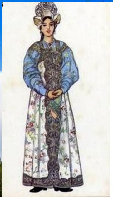
Праздничный женский костюм Новгородской губернии