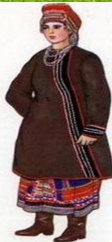
Женский костюм Калужской губернии