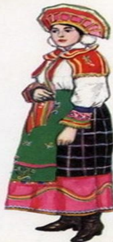
Костюм девушки Орловской губернии