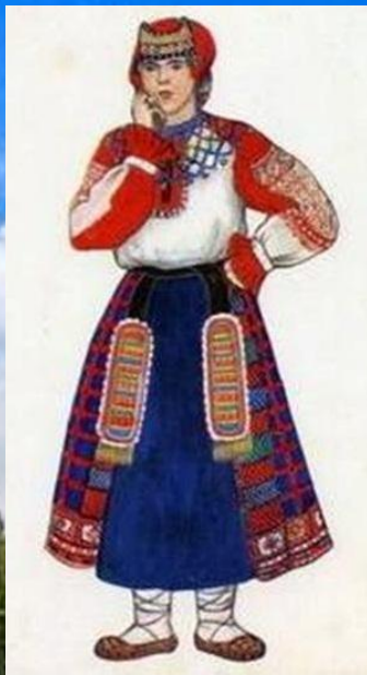
Костюм девушки Воронежской губернии