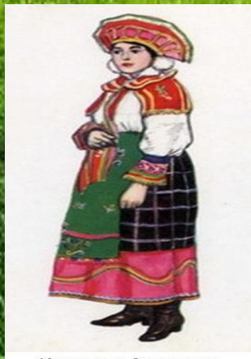
Костюм девушки Орловской губернии