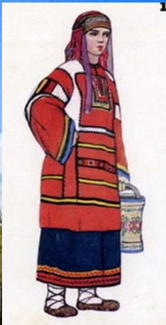
Женский костюм Тамбовской губернии