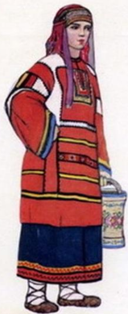
Женский костюм Тамбовской губернии