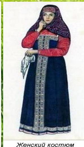
Женский костюм Ярославской губернии