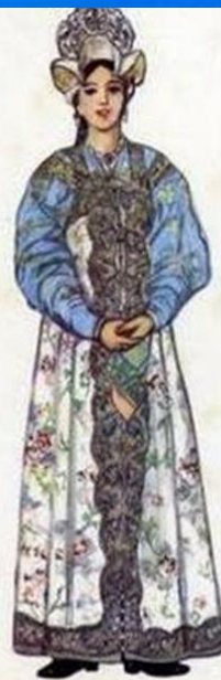
Праздничный женский костюм Новгородской губернии