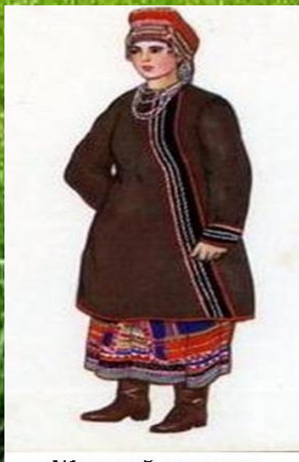
Женский костюм Калужской губернии