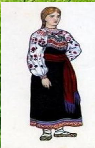
Костюм девушки Курской губернии