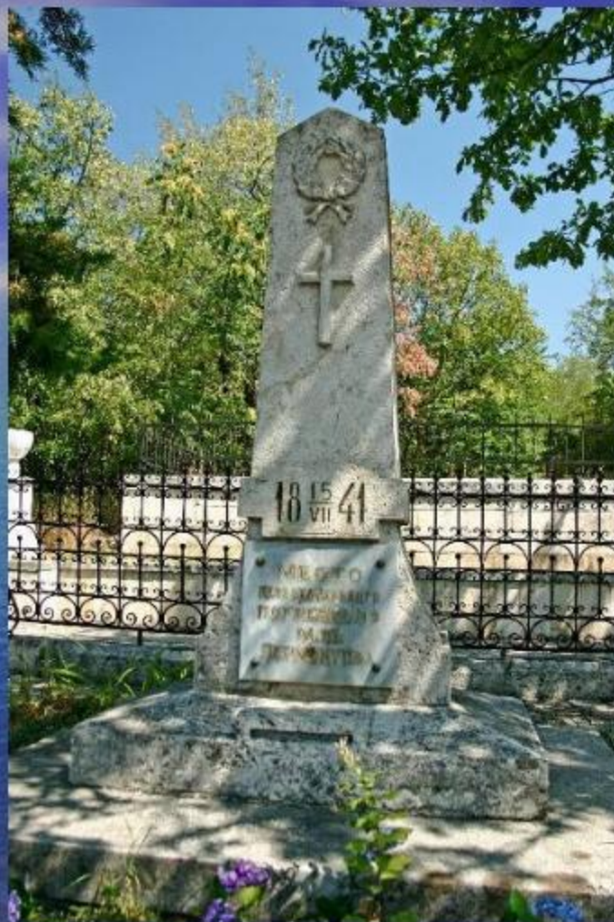
Место первоначального погребения Лермонтова в Пятигорске