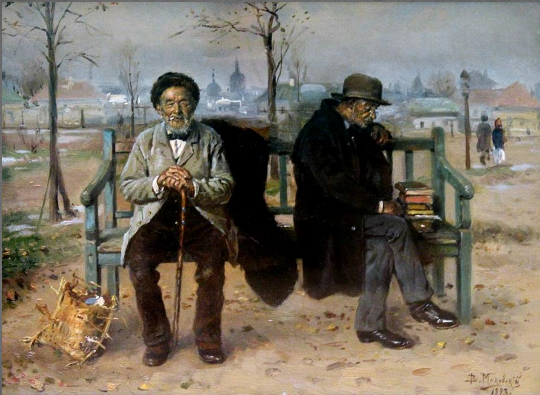
Оптимист и пессимист. Национальный художественный музей Республики Беларусь, г. Минск. 1893 г.