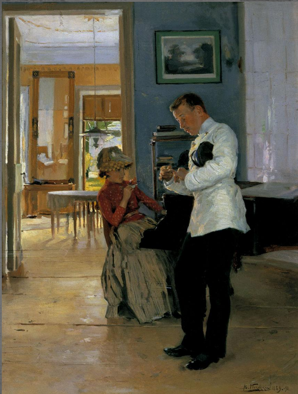
Объяснение. ТТ. 1889-1891 гг.