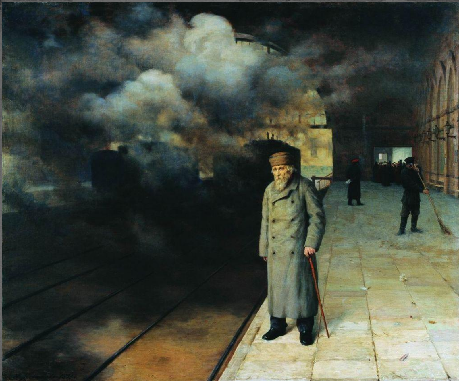
Проводил. 1891 г.