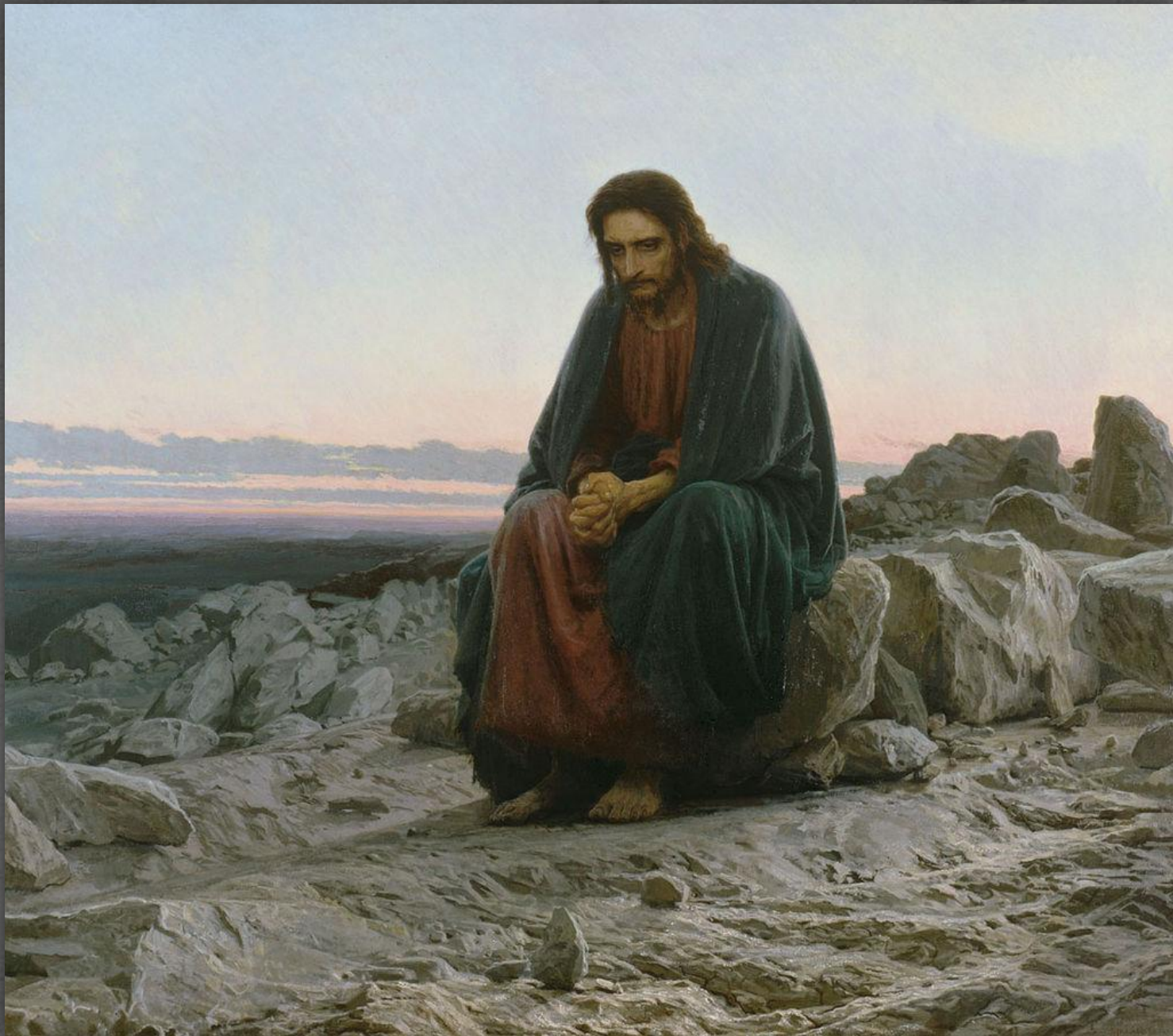
Христос в пустыне. ТГ. 1872 г.