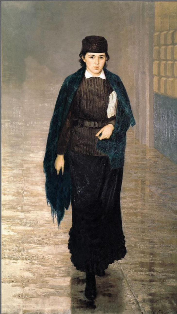
Курсистка. ГРМ. 1880 г.