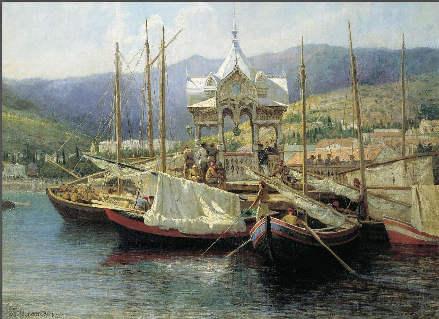
Пристань в Ялте. Владими́ро- Сузда́льский музей-заповедник. 1890 г.