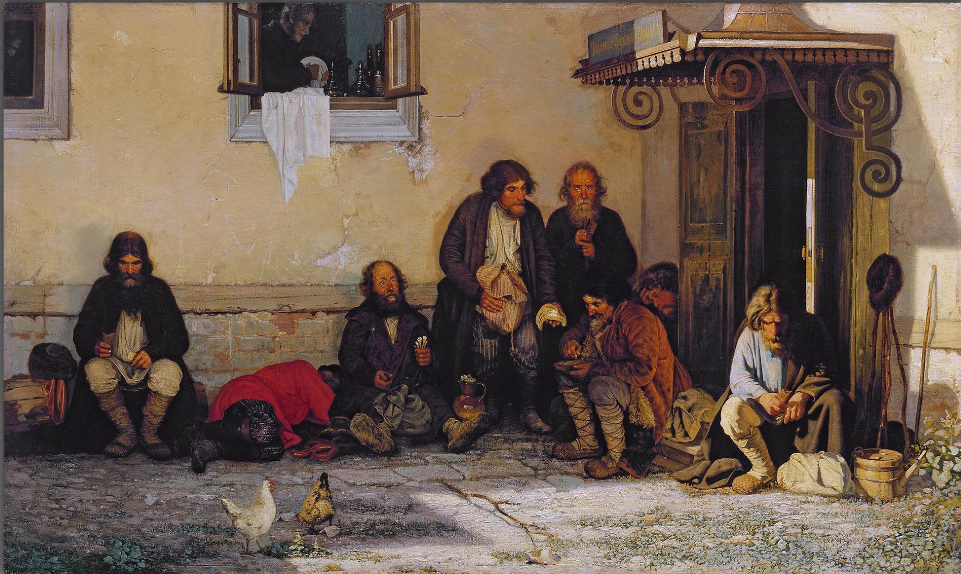
Земство обедает. ТГ. 1872 г.