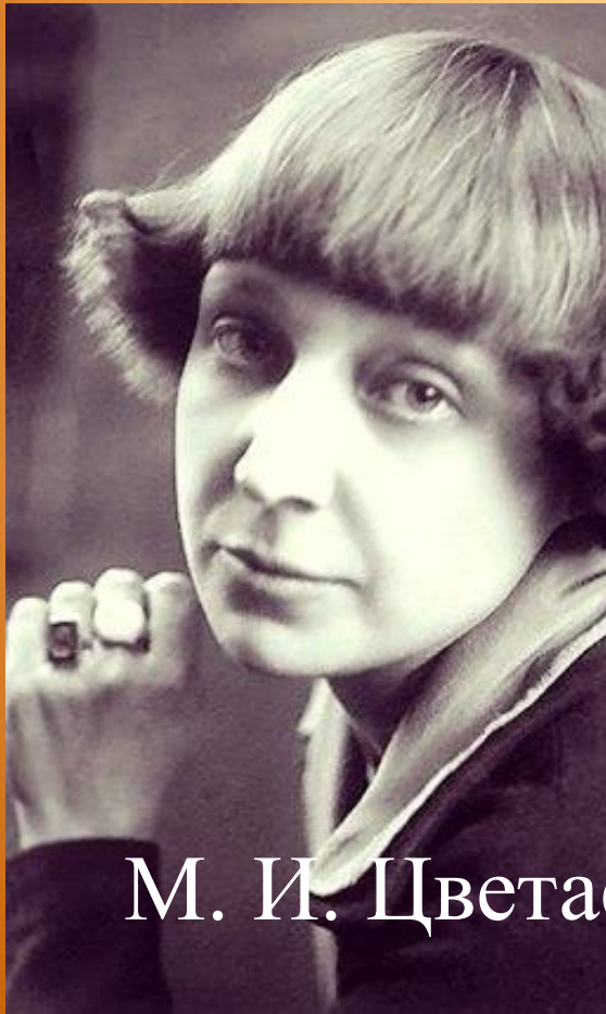
М. И. Цветаева