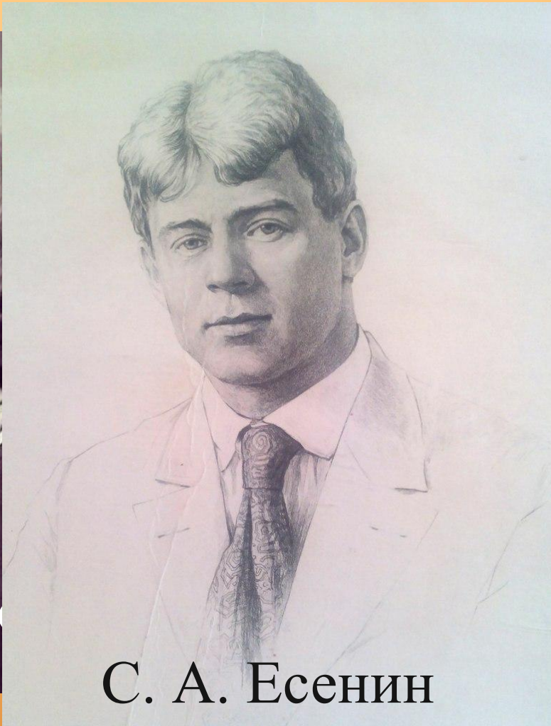
С. А. Есенин