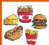
Фаст-фуд, чипсы, соленые орешки