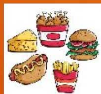
Фаст-фуд, чипсы, соленые орешки