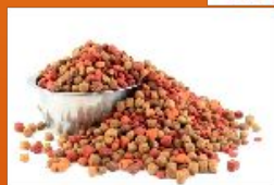
Корм для животных