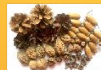
Орехи, шишки, желуди