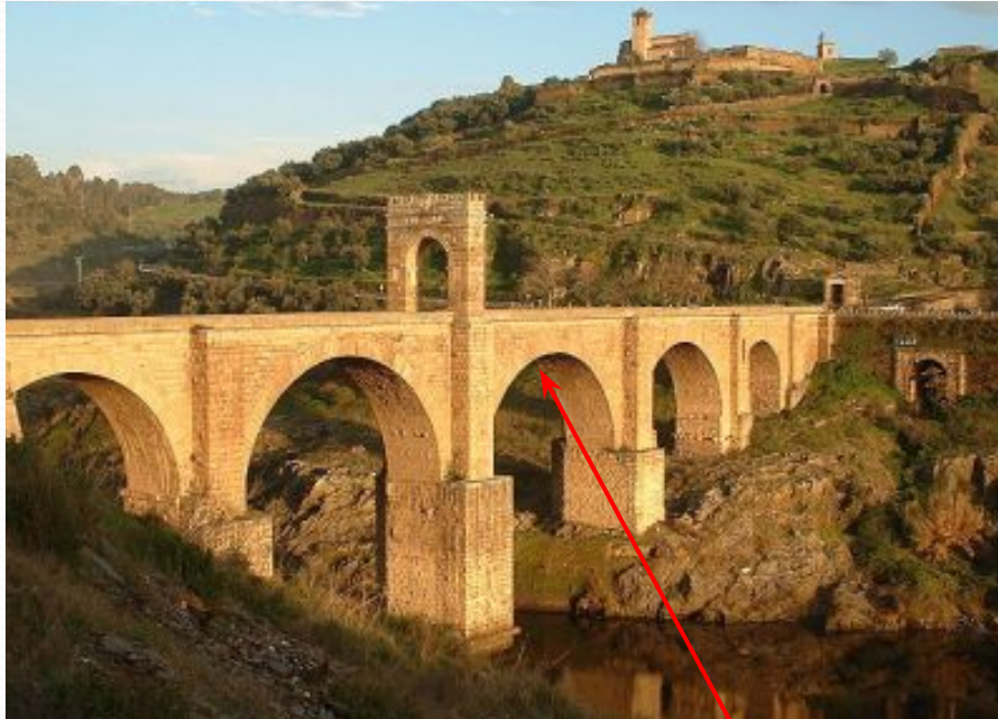
Римский мост с полуциркульными арками. Алькантара, Испания

Термин «романский стиль» ввёл в начале XIX века Арсисс де Комон (французский антиквар и археолог из дворянского рода Комонов, основатель Французского археологического общества), установивший связь архитектуры XI—XII веков с древнеримской архитектурой (в частности, использование полуциркульных арок, сводов ).