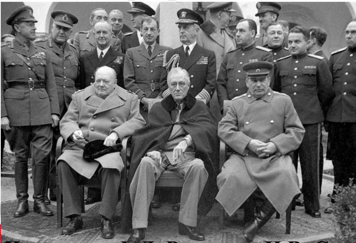
У. Черчилль, Ф.Д. Рузвельт, И.В. Сталин