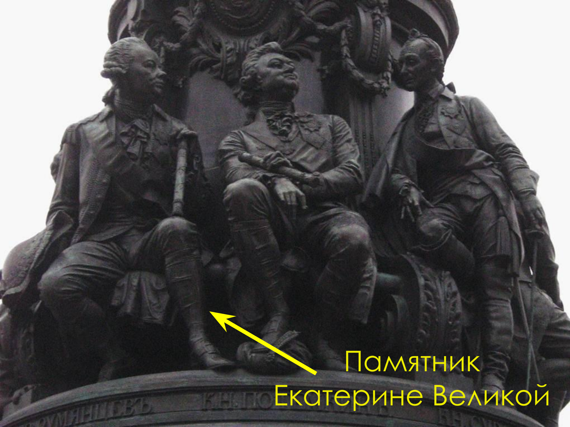
Памятник Екатерине Великой