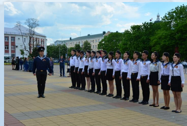
МБОУ "Лицей №35" ДОО "Глобус"