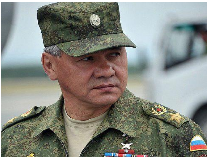
Министр обороны РФ Шойгу С.К.