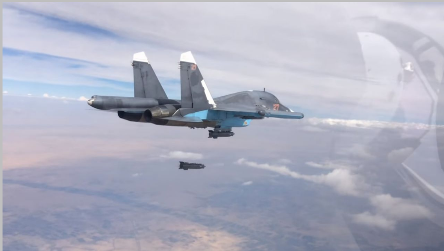
Су-34 сбрасывает авиабомбу КАБ-500-С (вес 560 кг)

В тот же день Совет Федерации дал Президенту РФ Владимиру Путину согласие на использование Вооруженных Сил РФ на территории Сирийской Арабской Республики. При этом речь шла лишь о применении военно-воздушных сил для оказания поддержки сухопутным войскам Сирии с воздуха, без проведения наземной операции.