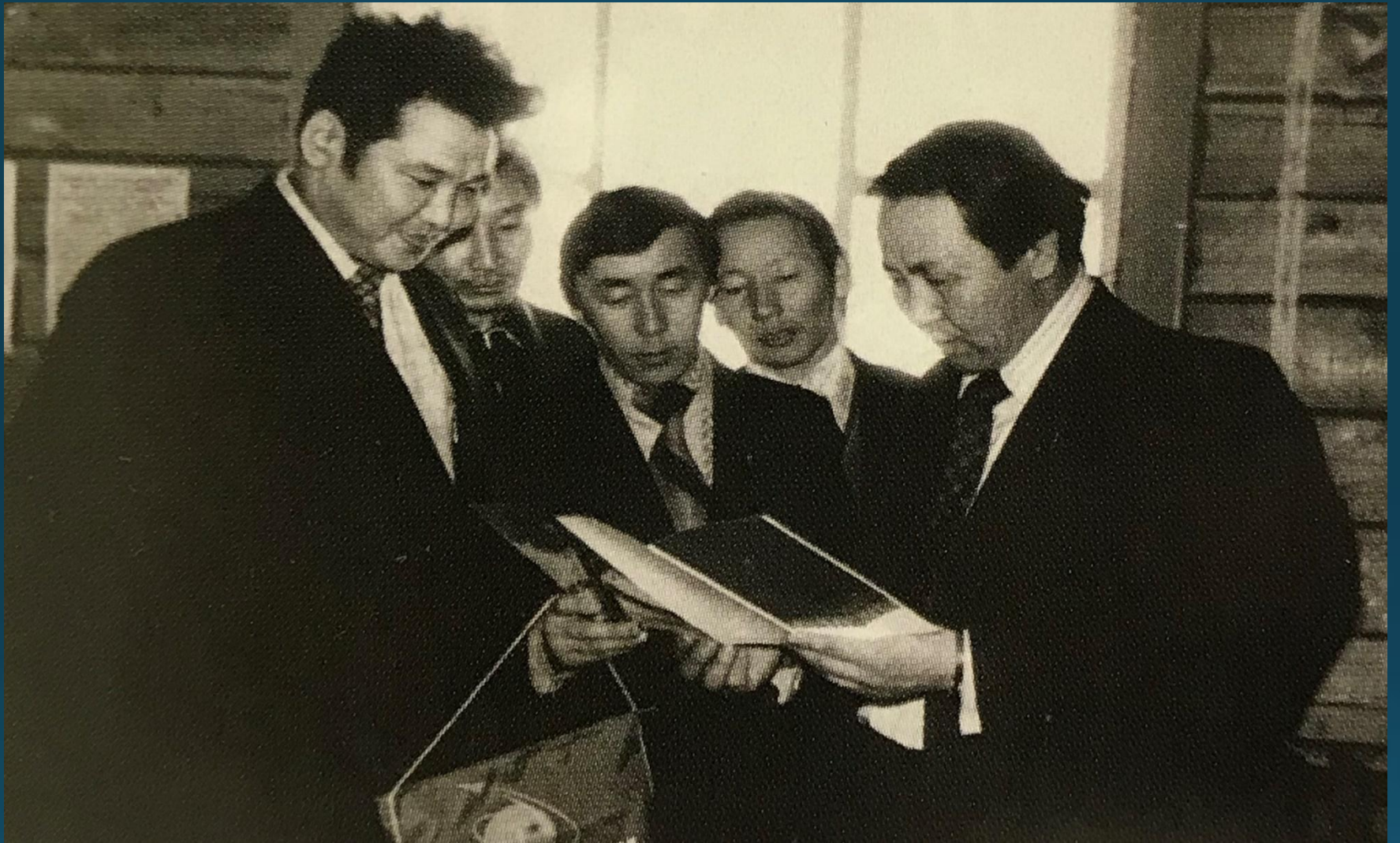
Директор совхоза имени В.И. Ленина, 1981 год.