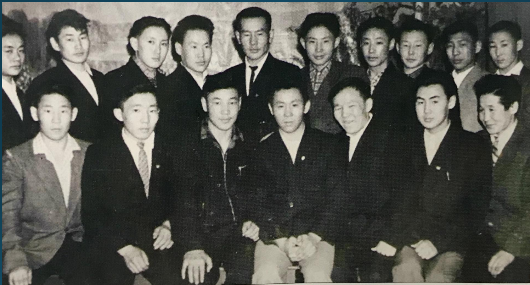
10 «а» класс. Майинская средняя школа. 1962 год