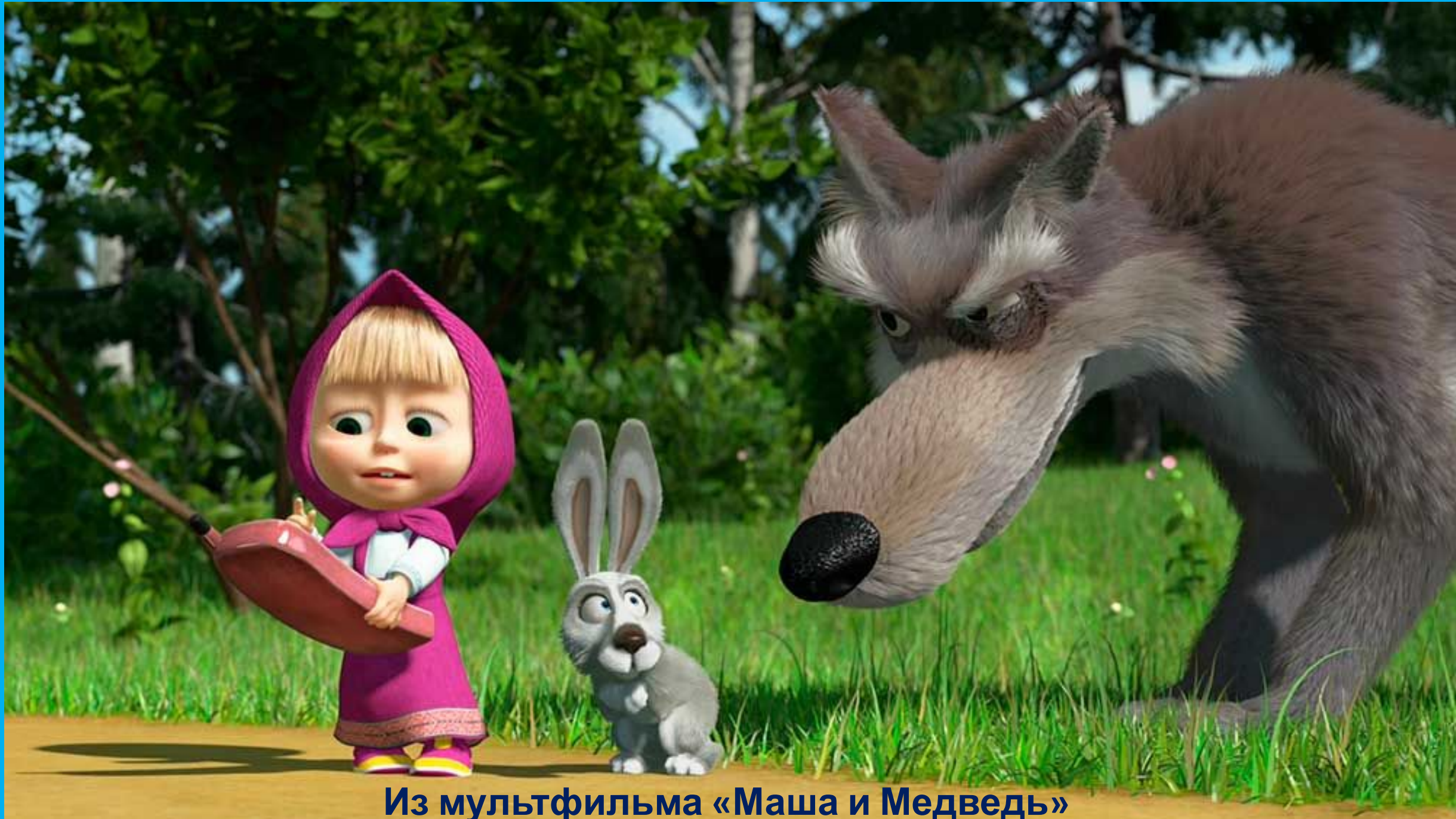
Из мультфильма «Маша и Медведь»