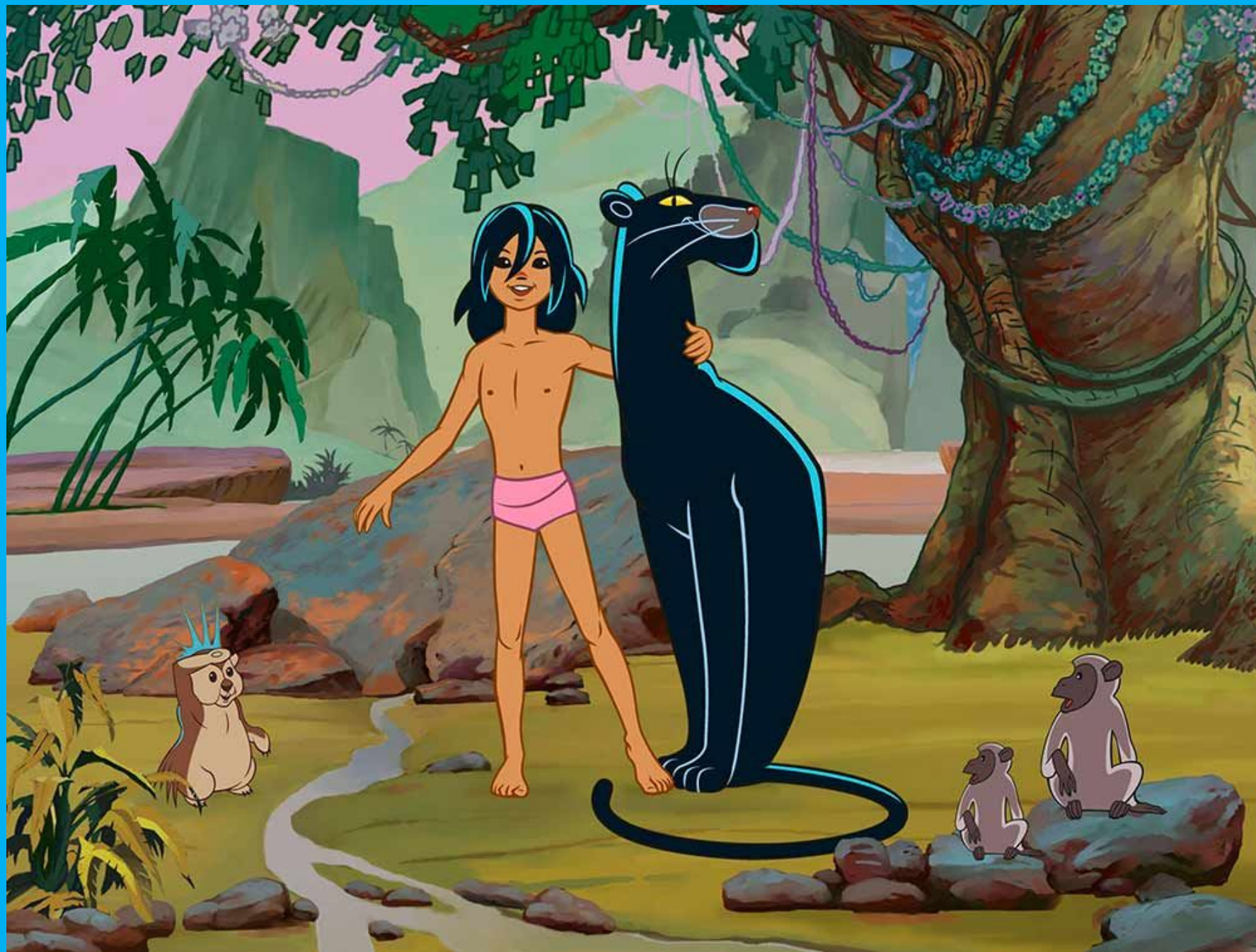
Из мультфильма «Маугли»