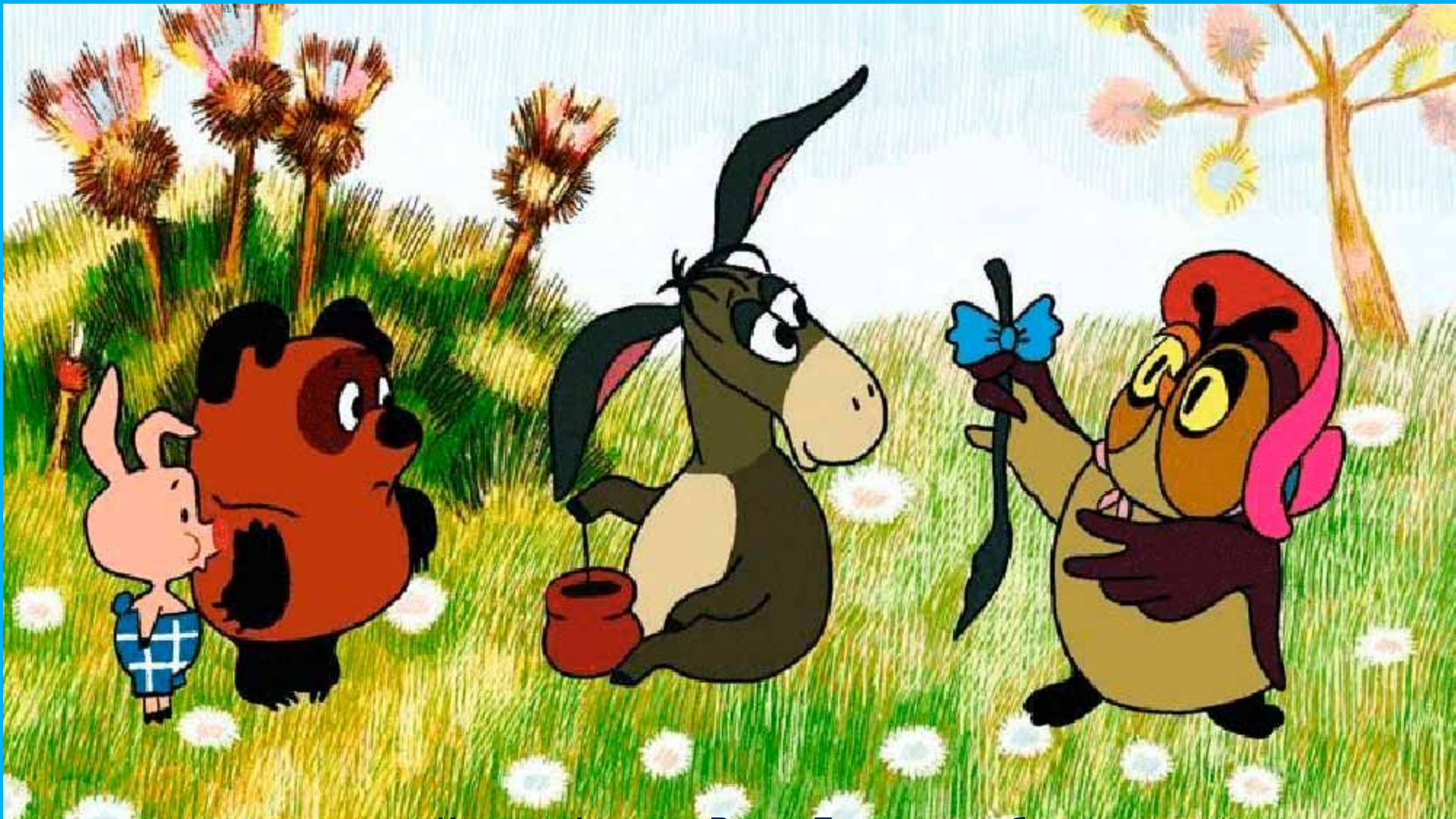
Из мультфильма «Винни-Пух и день забот»