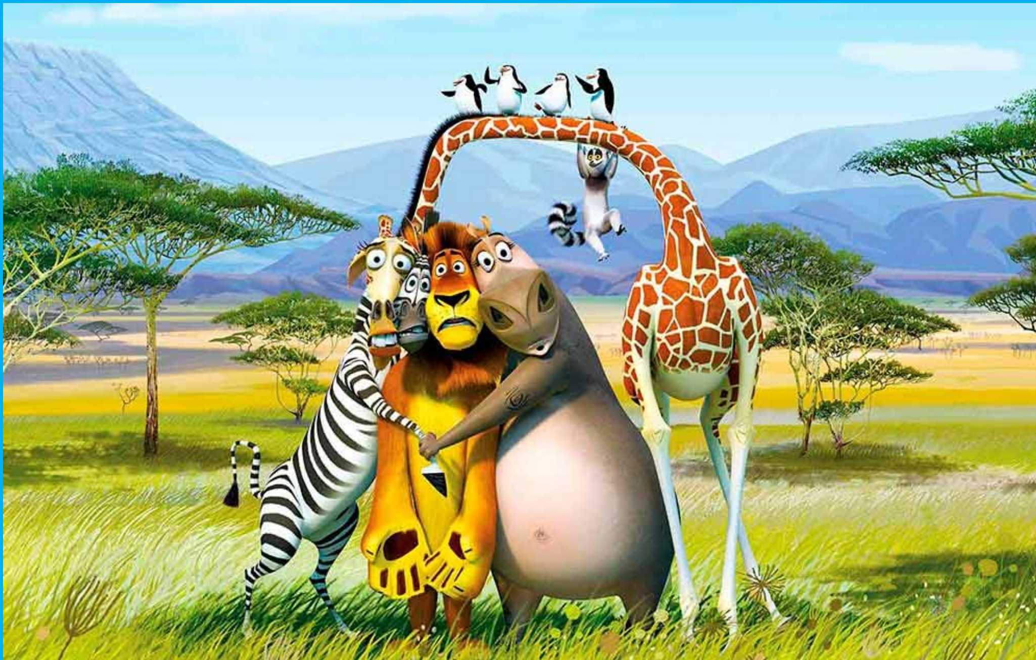
Персонажи мультфильма «Мадагаскар »