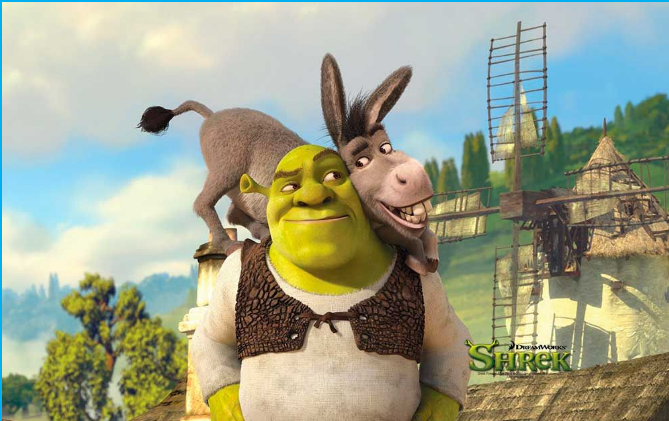
«Шрек и Осел»