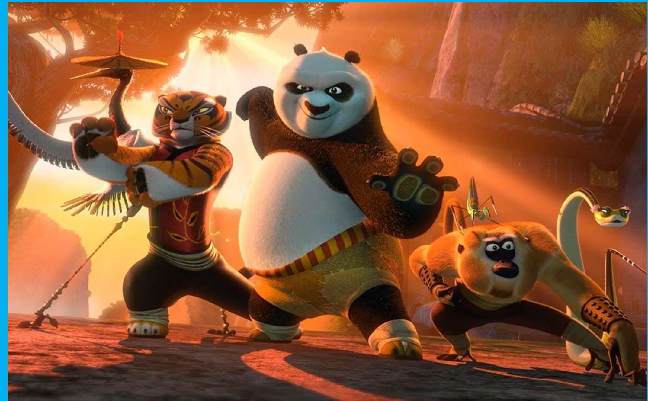
Персонажи мультфиль ма «Кунг-фу панда»