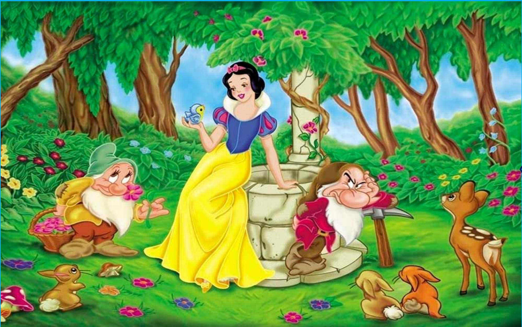
«Белоснежка и семь гномов»