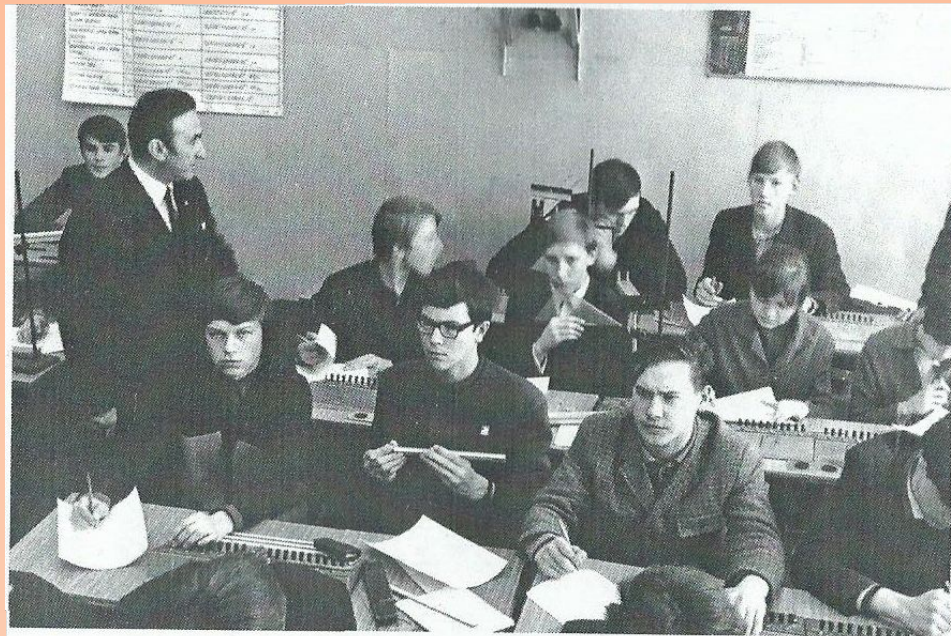
На уроке физики.

45 лет проработал в Радиотехническом Техникуме, где преподавал физику .