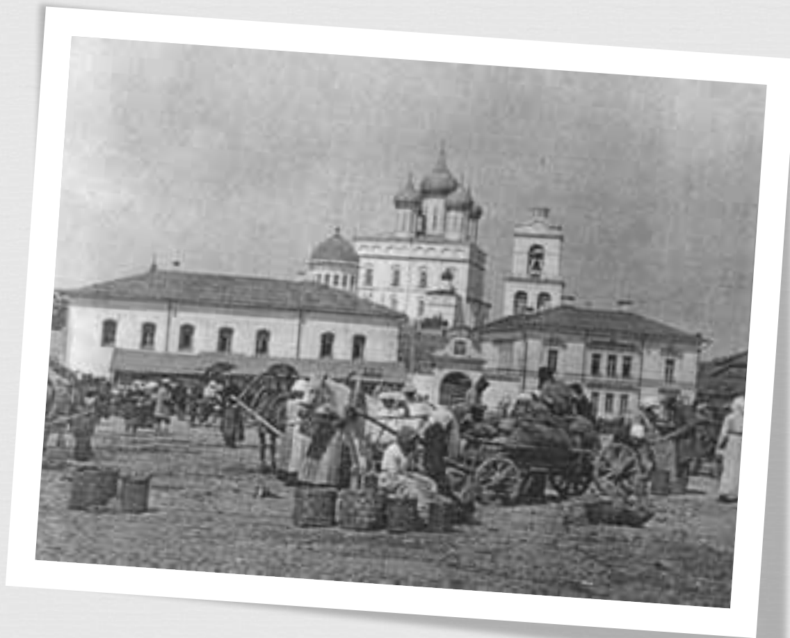
Торговля на площади Пскова