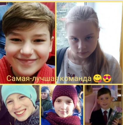
Самая-лучшая команда 😊💕