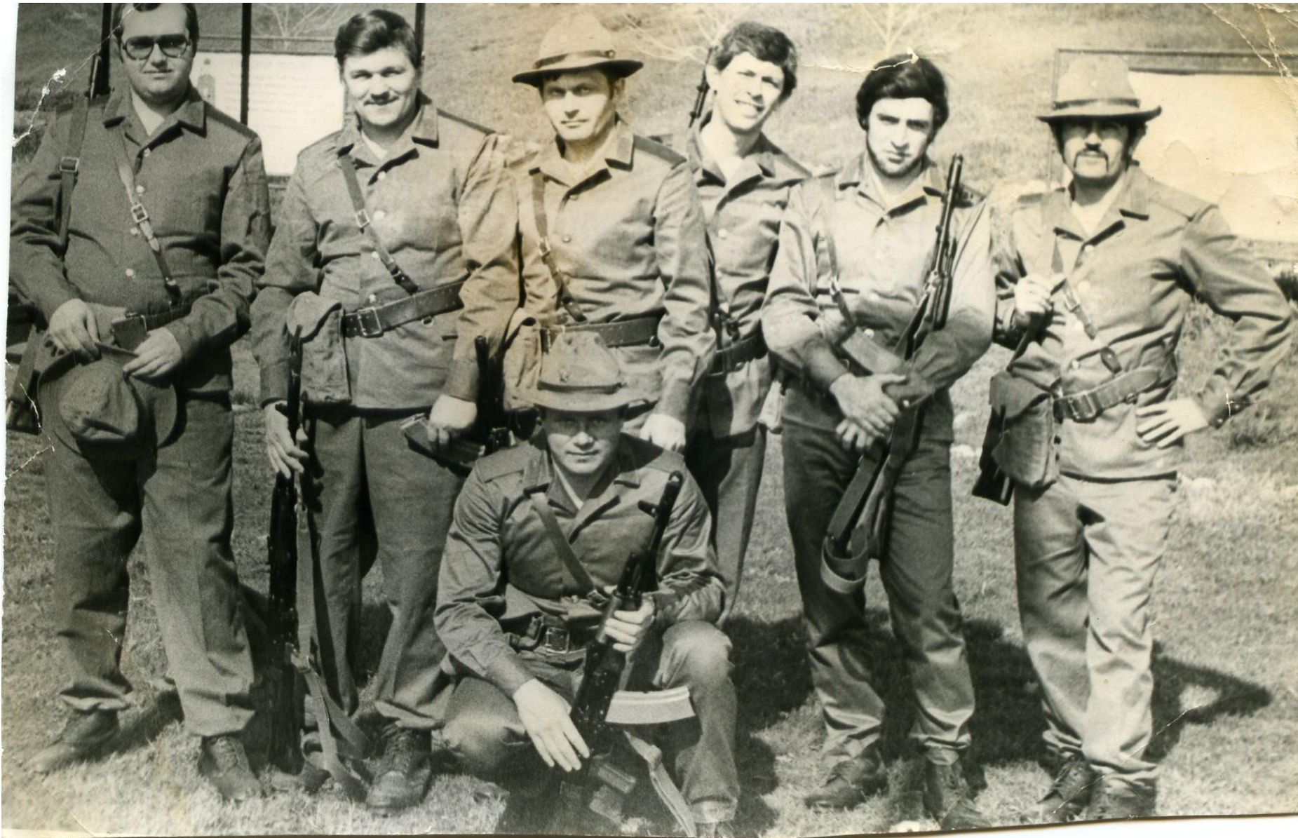
23. 03. 1981 г. группа разведчиков отряда «Кобольд»