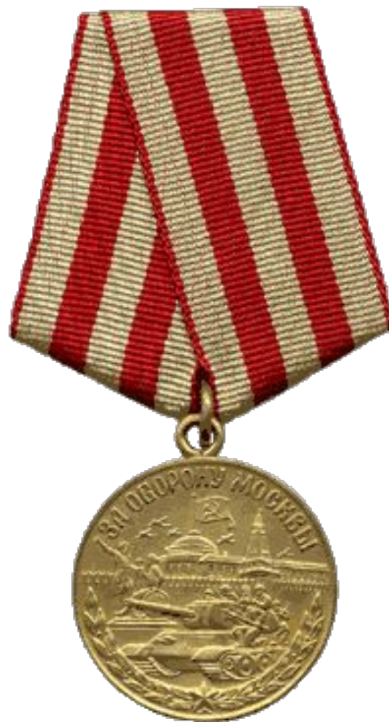
Медаль «За оборону Москвы»