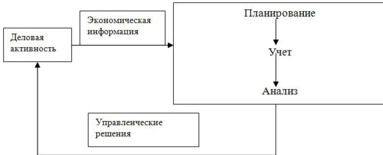
Рис. Функции управления предприятием

Управление предприятием осуществляется через реализацию управленческих функций: планирование, учет, анализ, принятие управленческих решений.