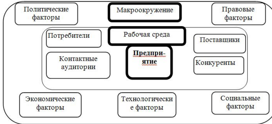
Рис. Схема взаимодействия предприятия с внешней средой