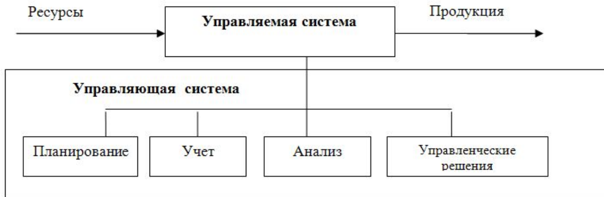
Рис. Управляемая и управляющая система