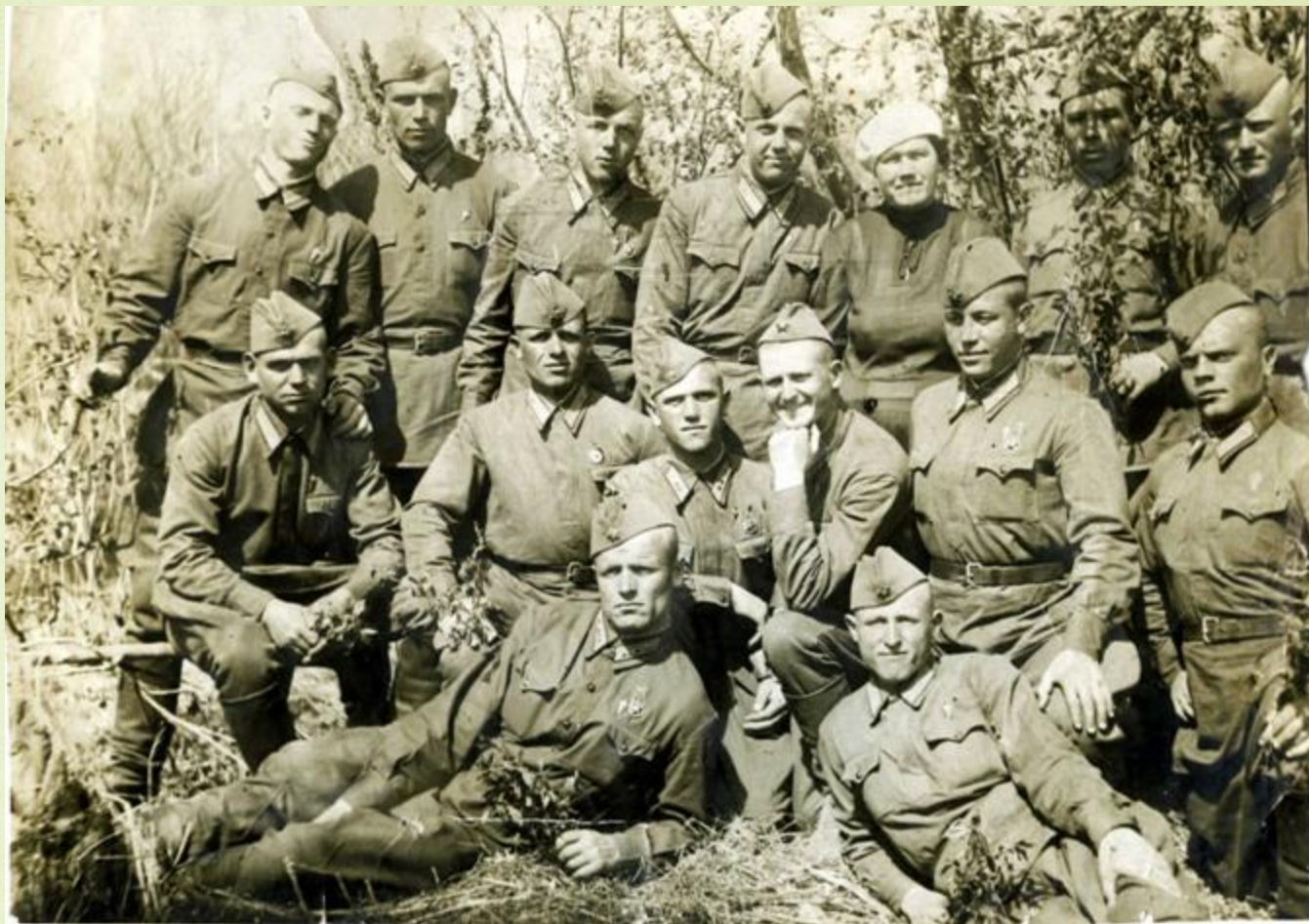
Смоленский полк, освободивший Мелеуз от белогвардейцев