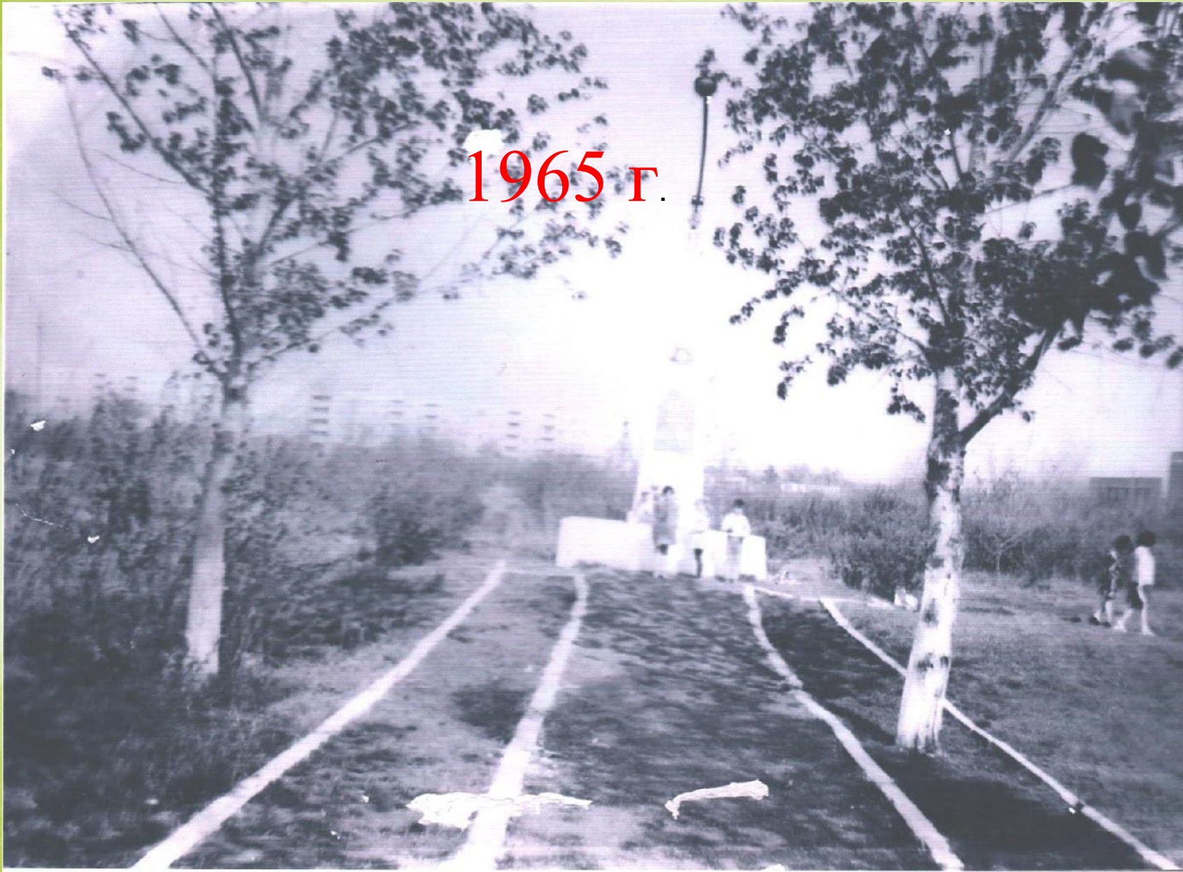
Обелиск, открытый к 20-летию победы советского народа в Великой Отечественной войне, 1965г (парк «Слава»)