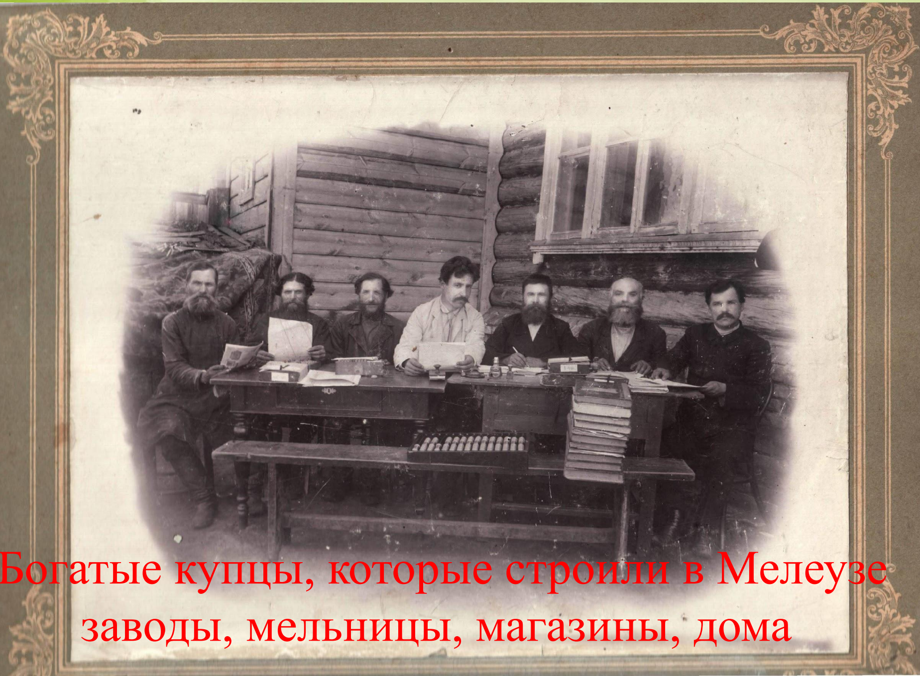
Богатые купцы, которые строили в Мелеузе заводы, мельницы, магазины, дома