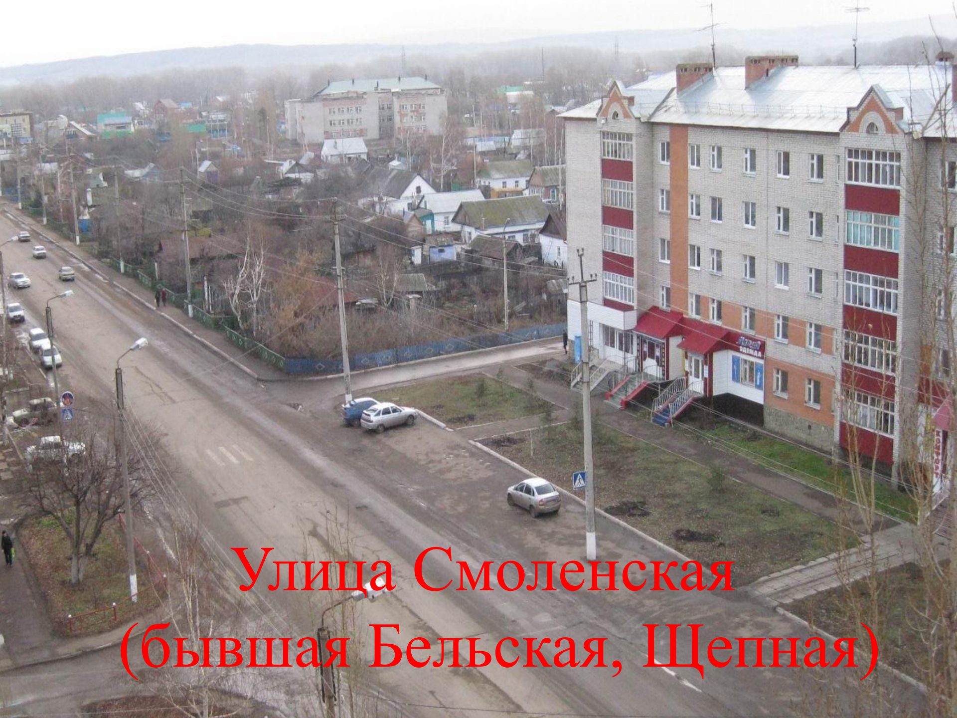
Улица Смоленская (бывшая Бельская, Щепная)