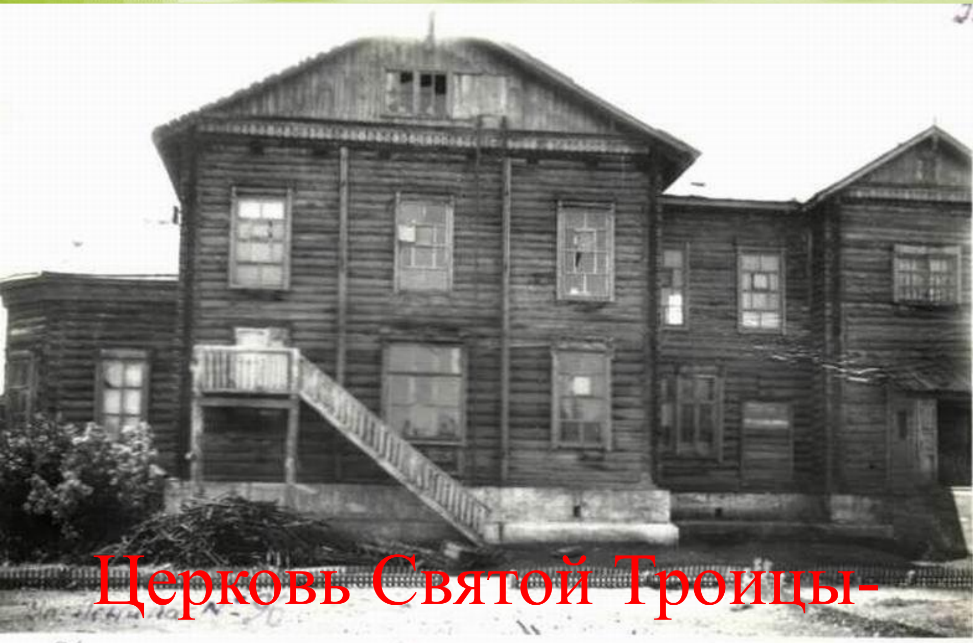
Церковь Святой Троицы- первая церковь в Мелеузе