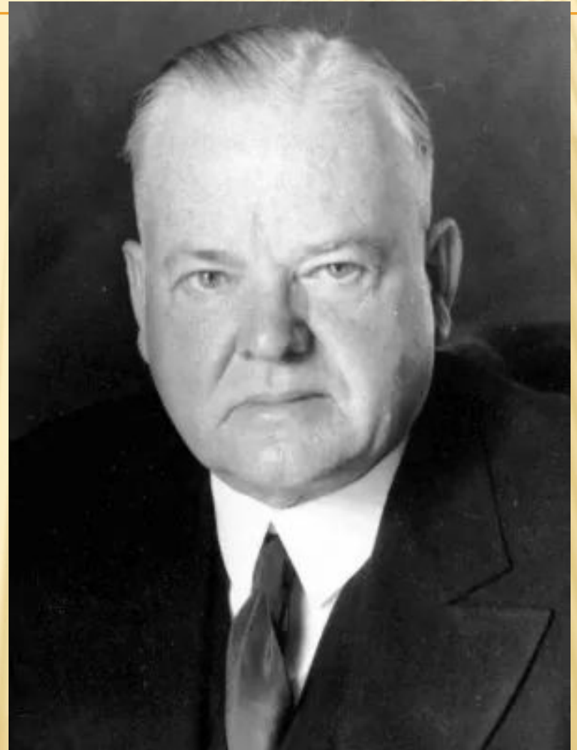
Герберт Гувер – 31 президент США