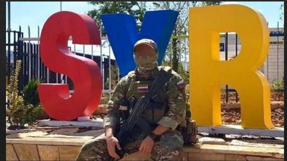
Фото сделано в Сирии