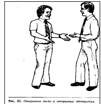
Рис. 82. Открытие тела и открытые отношения.