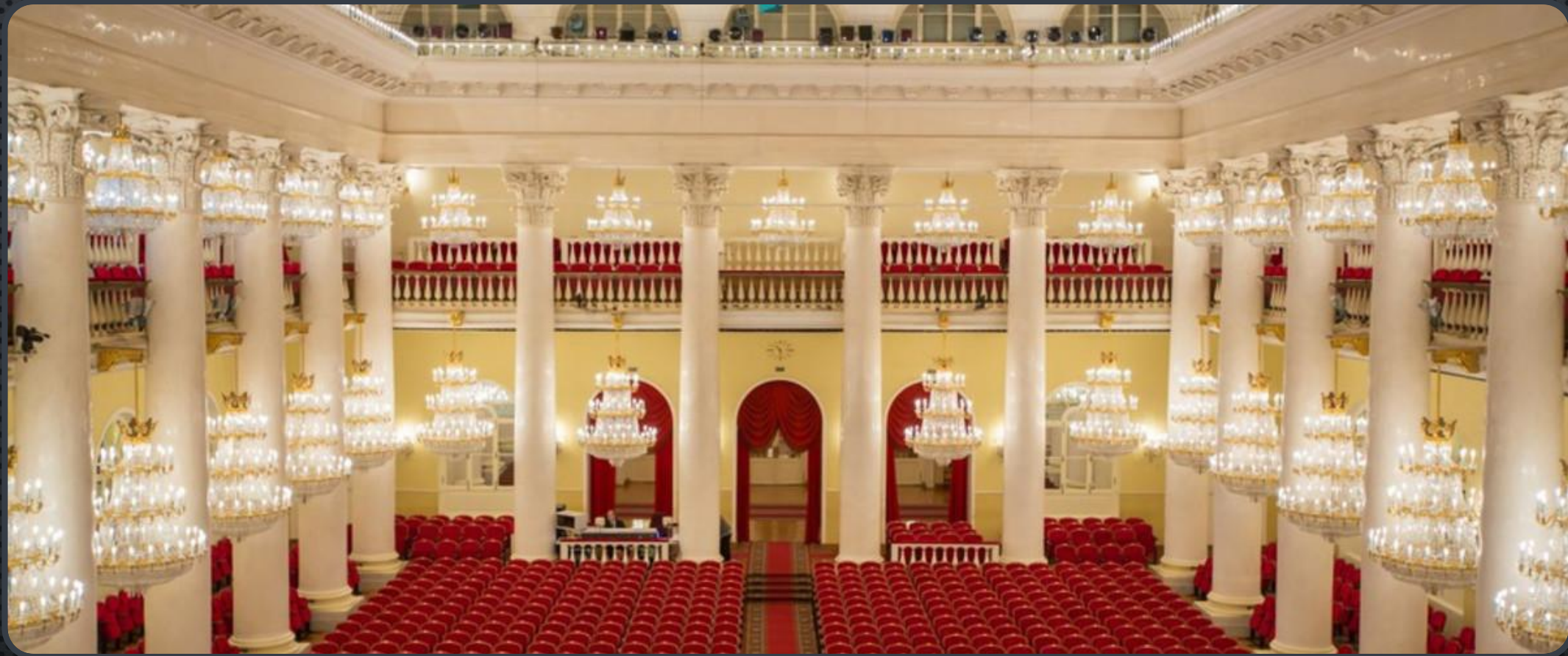
КОЛОННЫЙ ЗАЛ ДОМА СОЮЗОВ