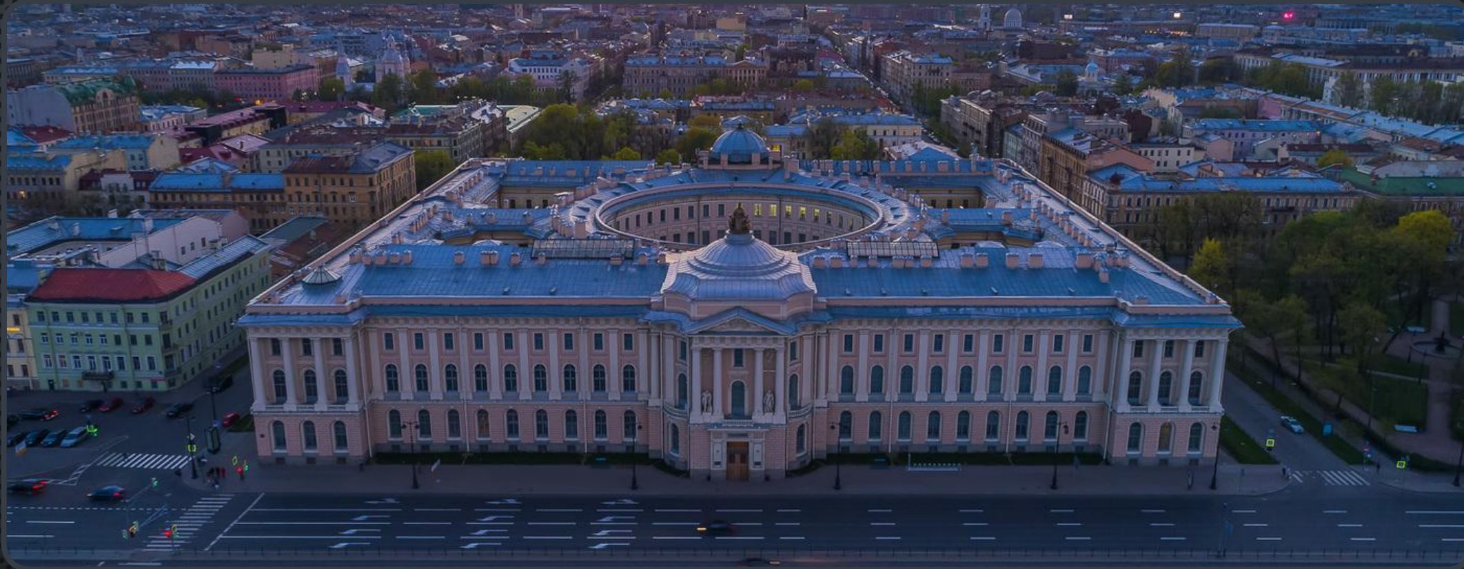
АКАДЕМИЯ ХУДОЖЕСТВ В ПЕТЕРБУРГЕ (1764 – 1788)