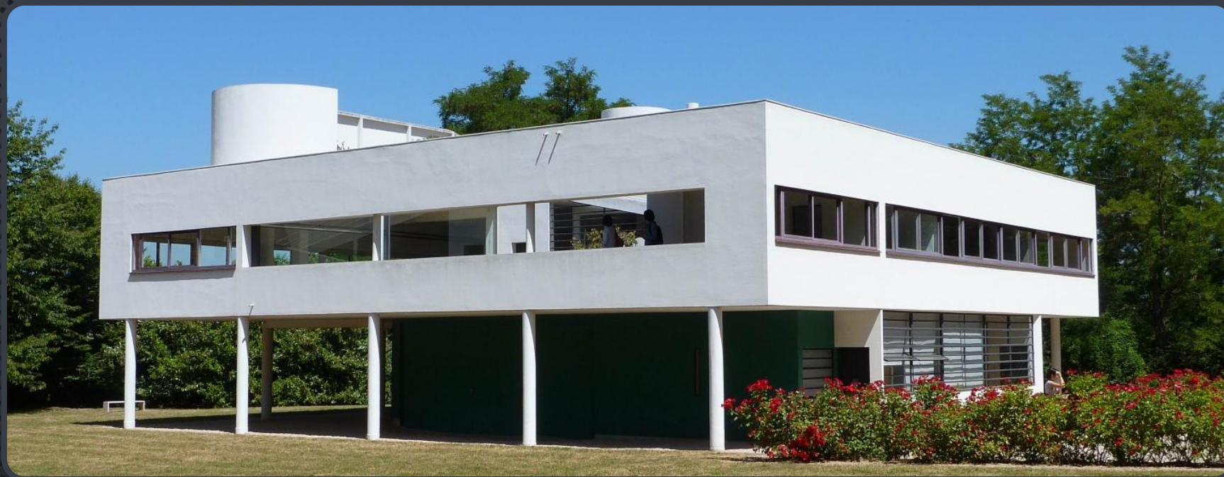
ВИЛЛА САВОЙ В ПУАССИ (1930)