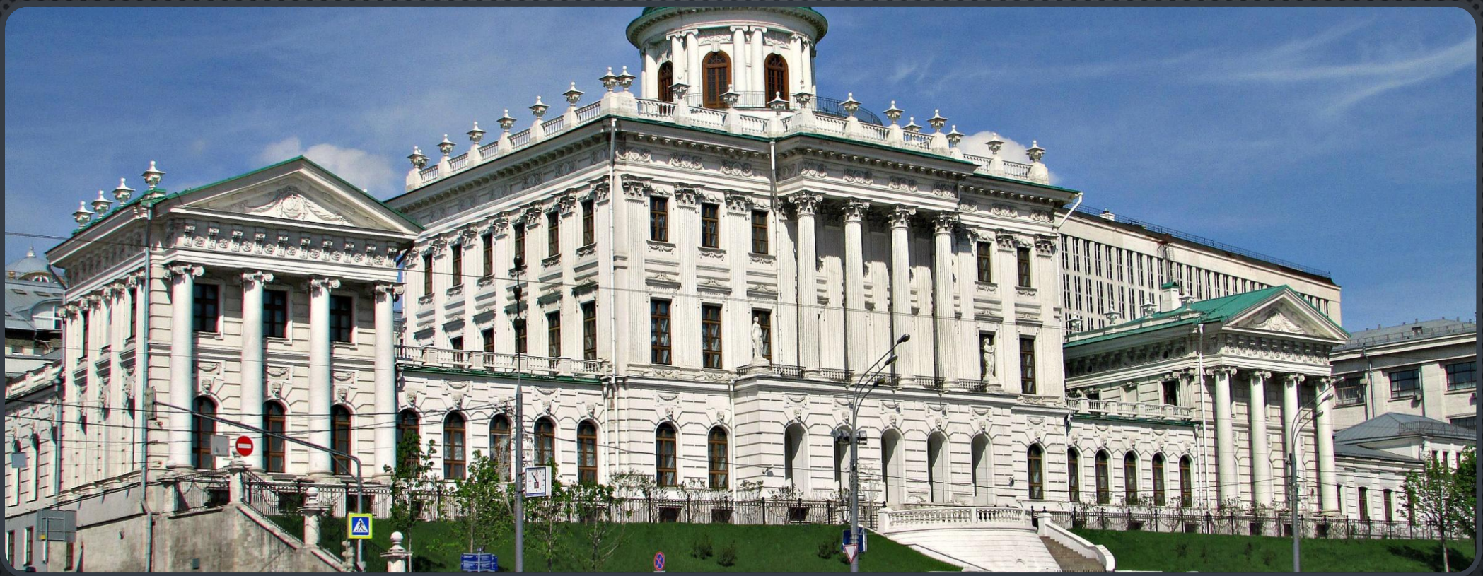
ДОМ ПАШКОВА В МОСКВЕ (1784-1786)