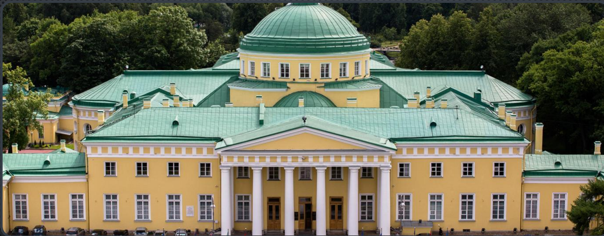
ТАВРИЧЕСКИЙ ДВОРЕЦ НА ШПАЛЕРНОЙ УЛИЦЕ В ПЕТЕРБУРГЕ (1783 – 1789)