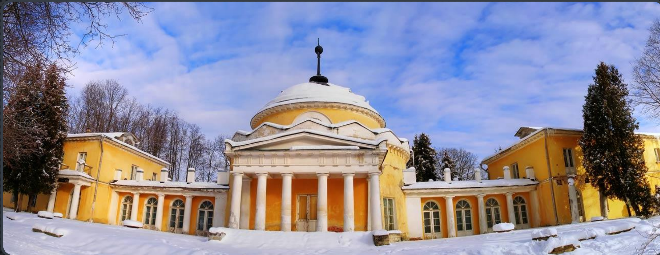
ГЛАВНЫЙ ДОМ УСАДЬБЫ «ЛЮБЛИНО» В МОСКВЕ