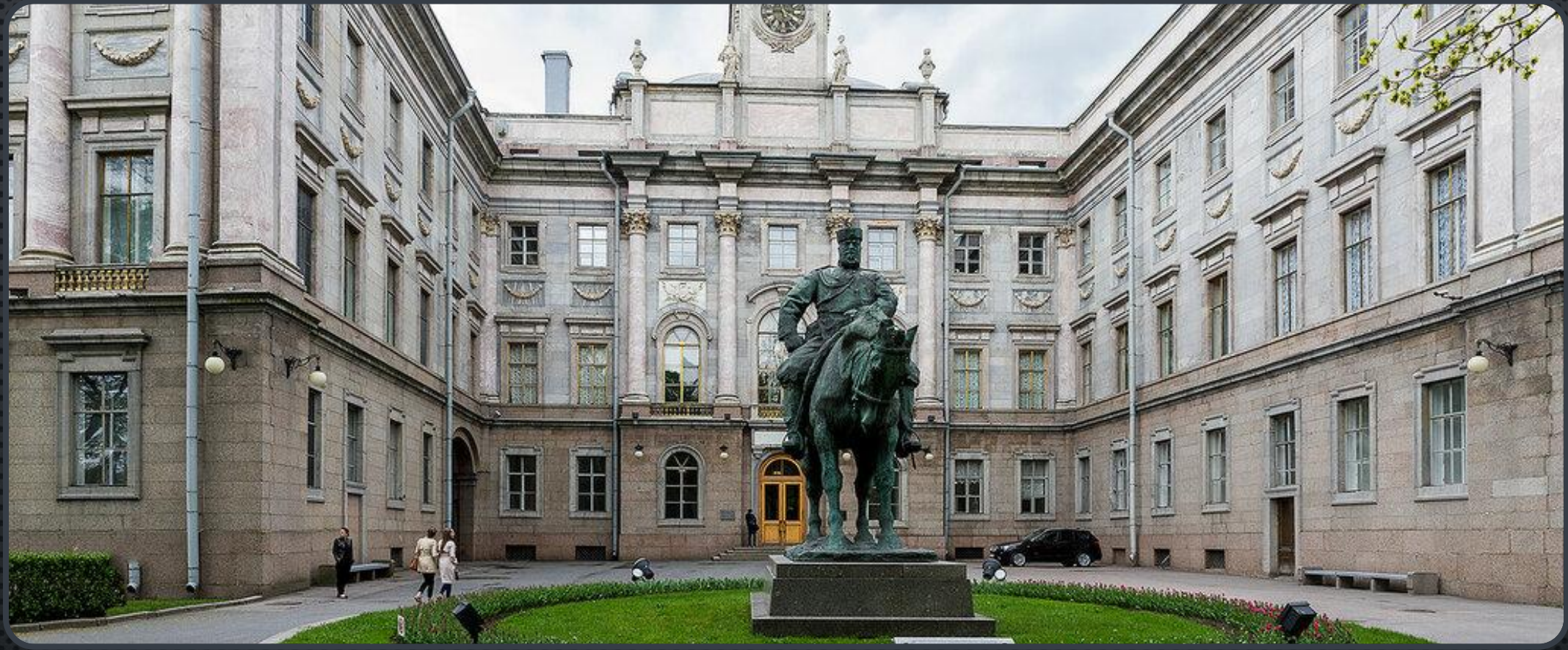
МРАМОРНЫЙ ДВОРЕЦ В САНКТ-ПЕТЕРБУРГЕ (1768-1785)