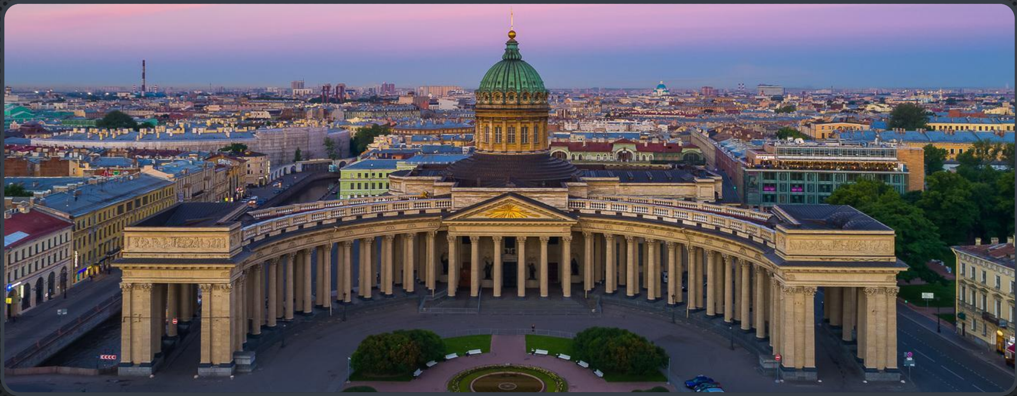
КАЗАНСКИЙ СОБОР В ПЕТЕРБУРГЕ (1801—1811)