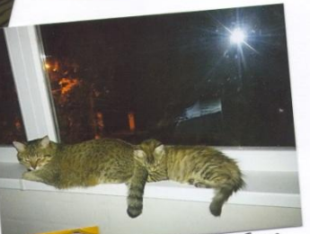
Люся и Барс