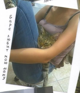
Барс в руках моей мамы