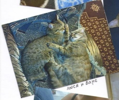
Люся и Барс