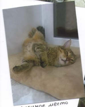
Любимое место Барса