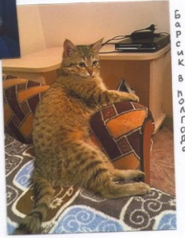
Барсик в полгодя