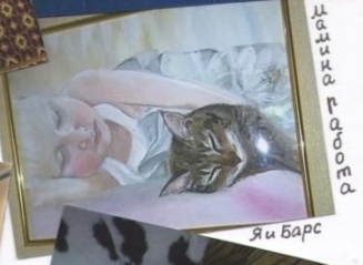
Я и Барс