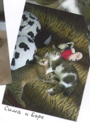
Сима и Барс