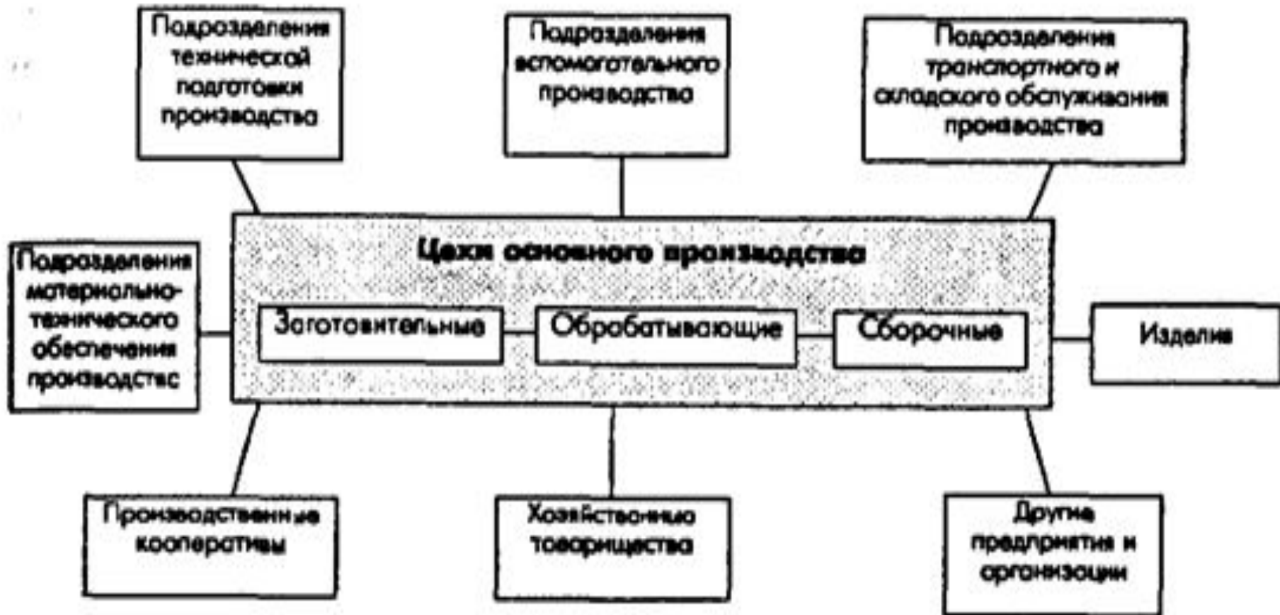
Рисунок 2 – Системное окружение цехов производственного предприятия