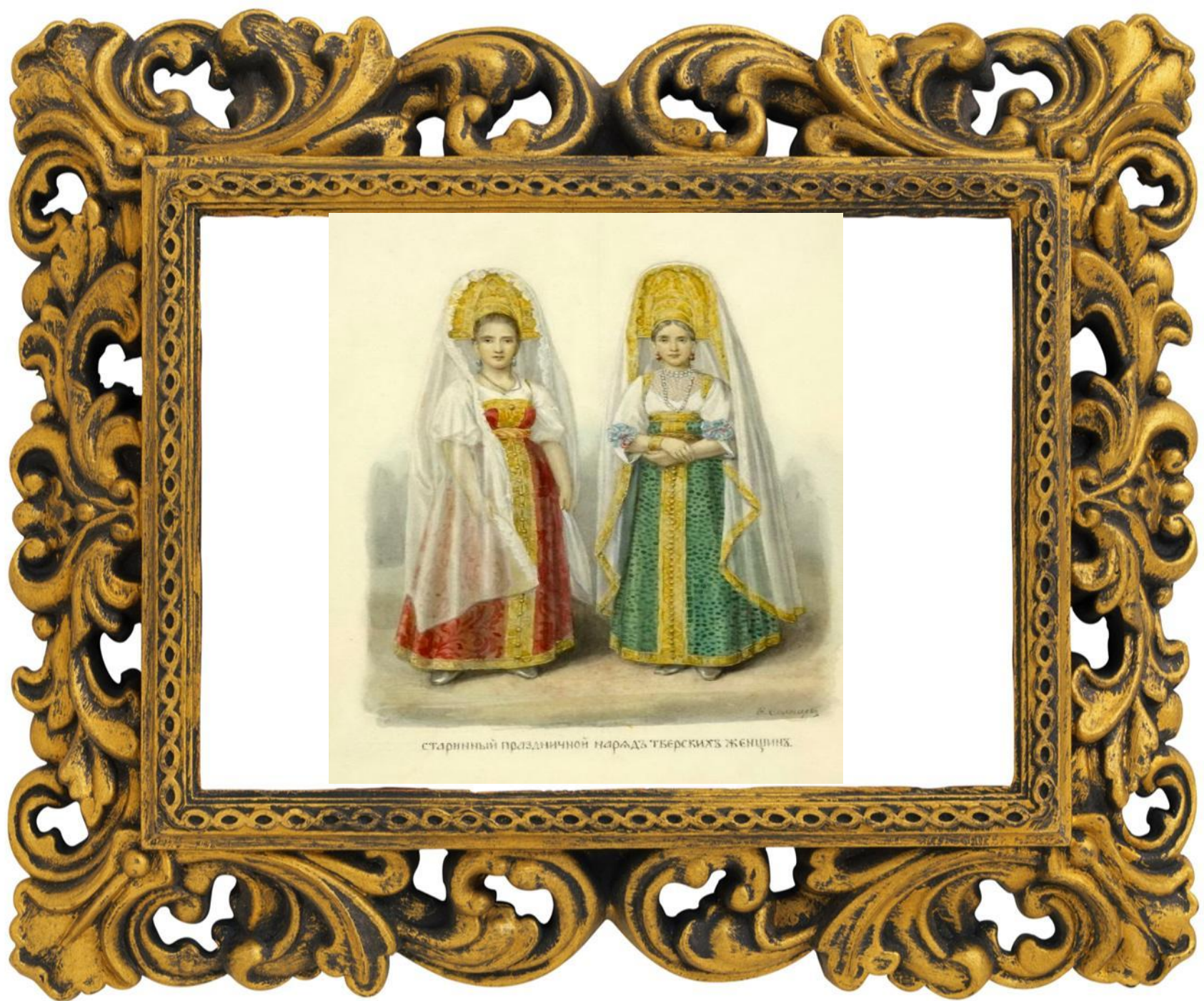
старинный праздничный наряд тверскихъ женщинъ.