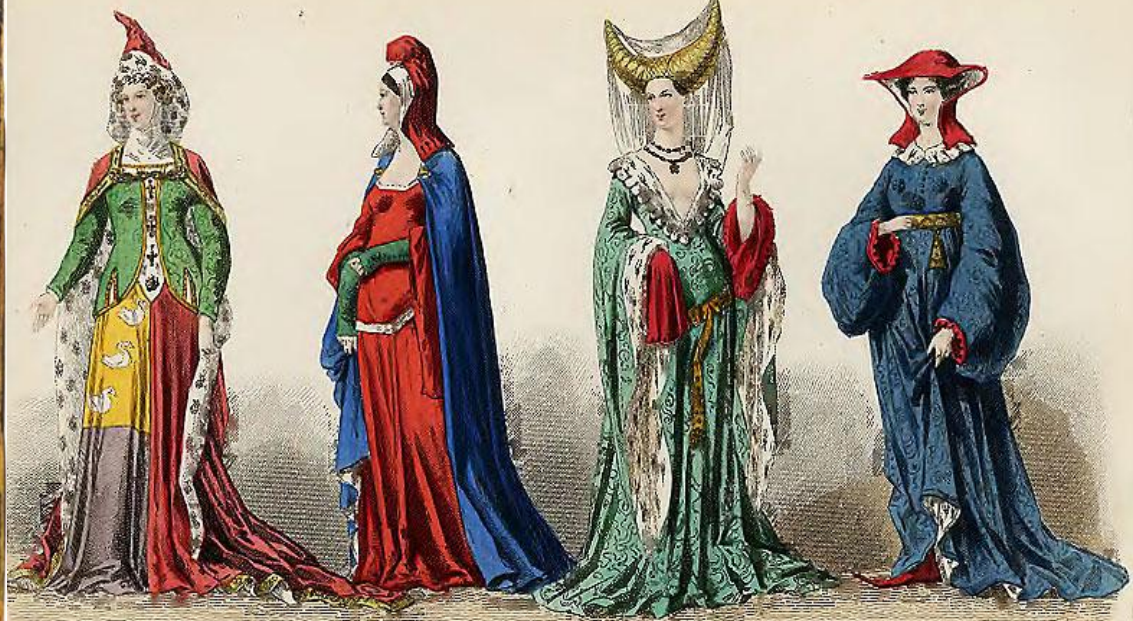
Charles V 1364 to 1386