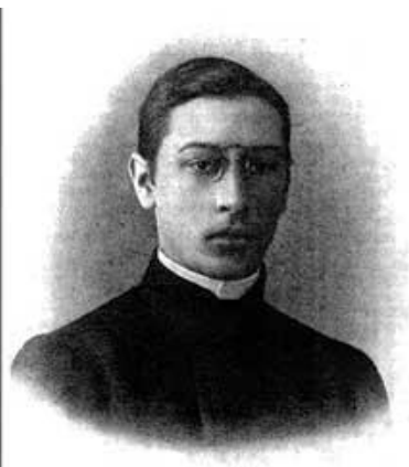
Игорь Стравинский в год окончания гимназии (1901 г.)