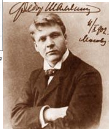
Федор Шаляпин 4/1902. Москва