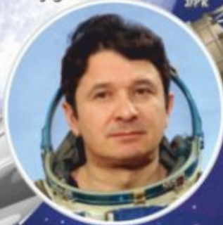
А.Д. КИЗИМ Космонавт, Донбасс