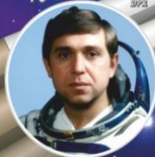
А.А. ВОЛКОВ Космонавт, Донбасс