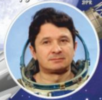
А.Д. КИЗИМ Космонавт, Донбасс