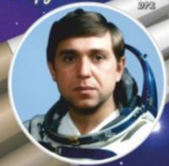
А.А. ВОЛКОВ Космонавт, Донбасс