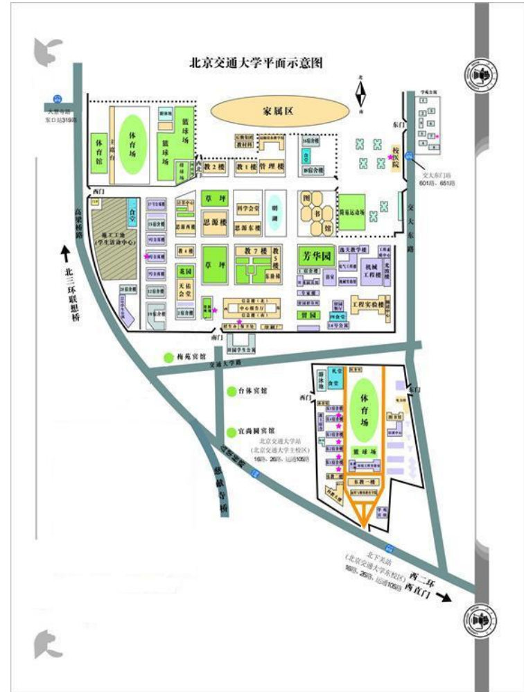
План южной части