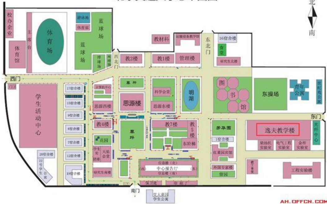
План главной части