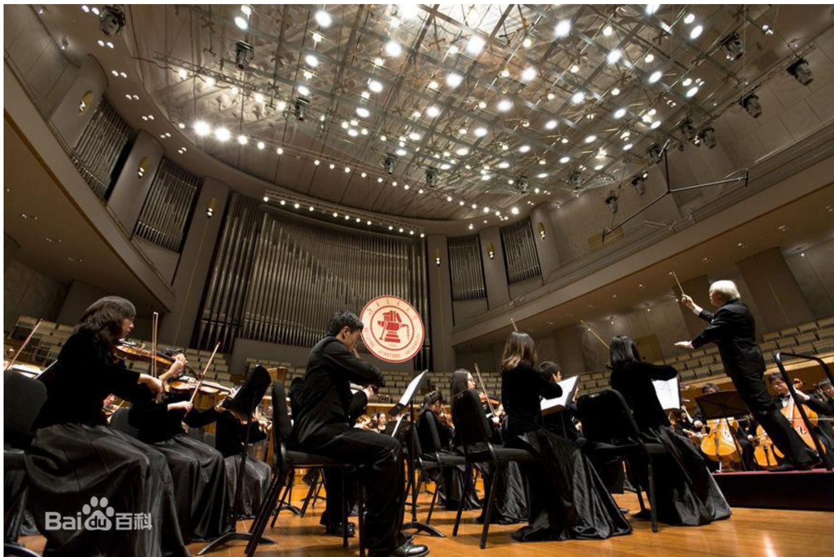
Оркестр университета играл в культурном центре.