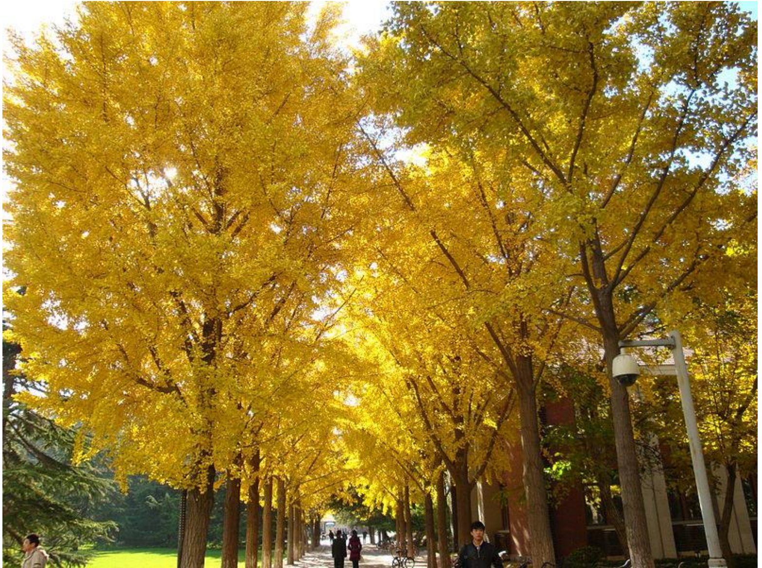
Гинкго двулопастный в университете