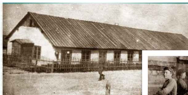
Барак для рабочих завода