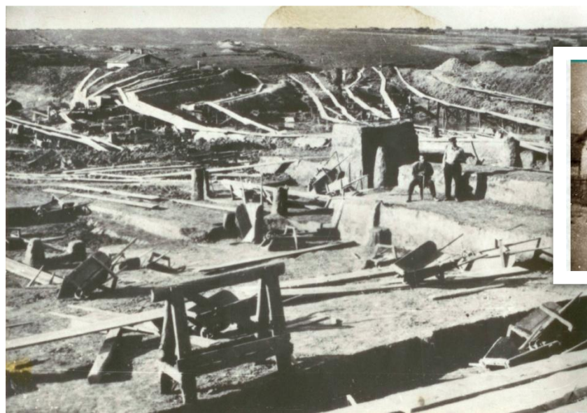
Вид строительной площадки завода. 1932г.