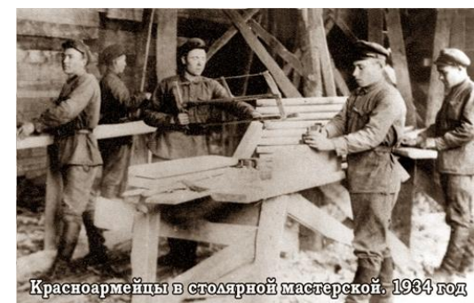
Красноармейцы в столярной мастерской. 1934 год