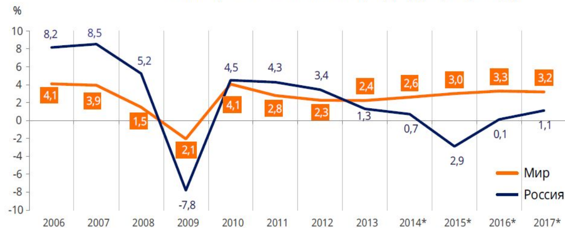
Темпы роста ВВП, % к предыдущему году

2) В Петербурге в конце 1916 г. был кризис продовольствия. Хлеба нет. Холод и глад для низших классов. Есть нечего. Значит - выход на улицы. Даже Февральская - была революцией голодных. 2017 г. - все более-менее сыты. ВВП на душу населения в 8-10 тыс. долл. (пусть средняя температура по больнице) позволяет жить более-менее спокойно.