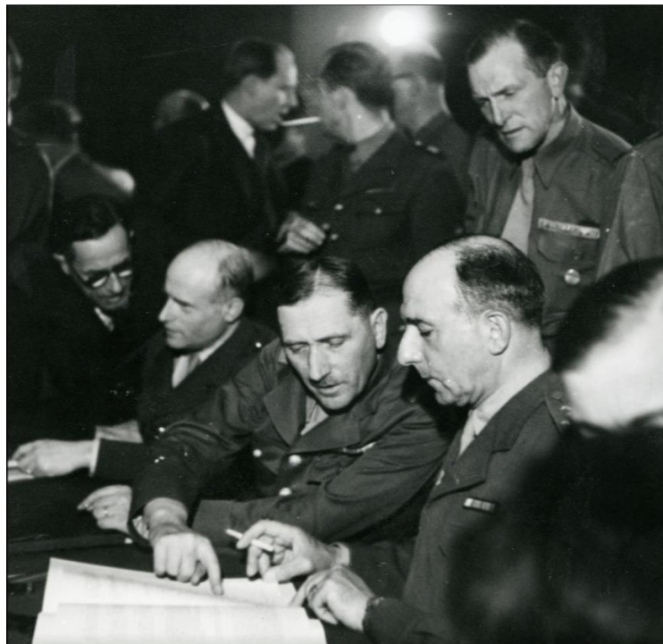
La France est représenté par le général de Lattre (de profil) à Berlin