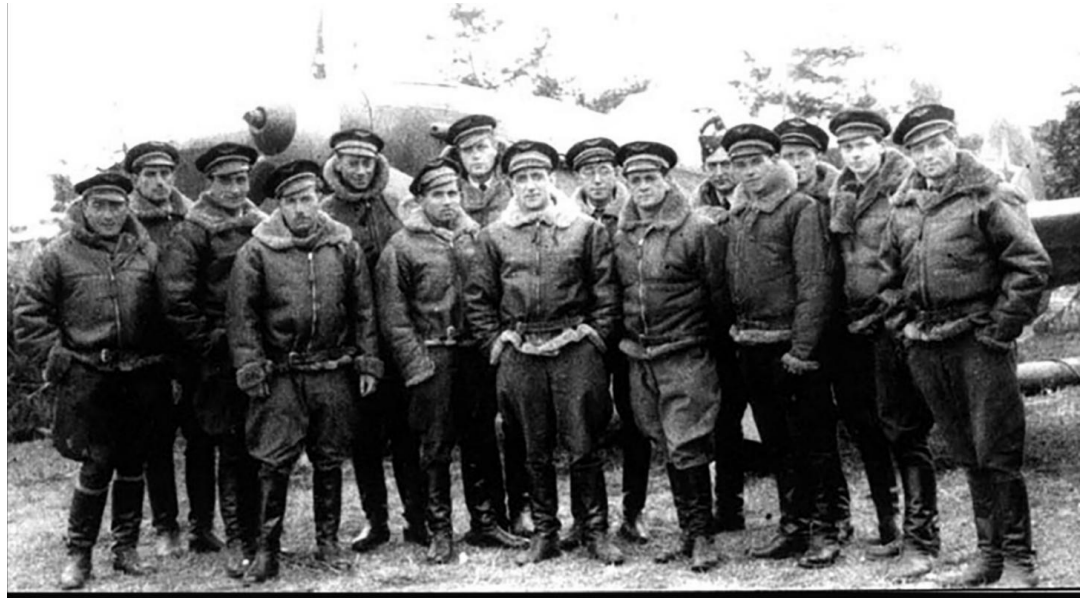
Aviateurs français posant devant un Yak-3, 1943.