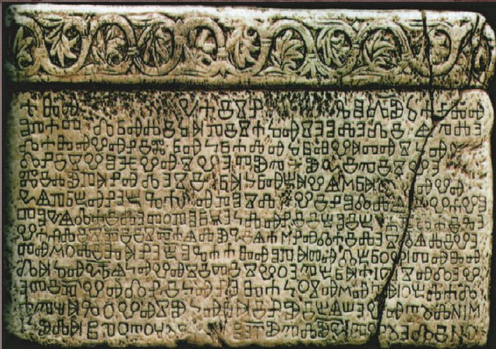
Башчанская (Бошканская) плита — один из древнейших известных памятников глаголицы, XI в.