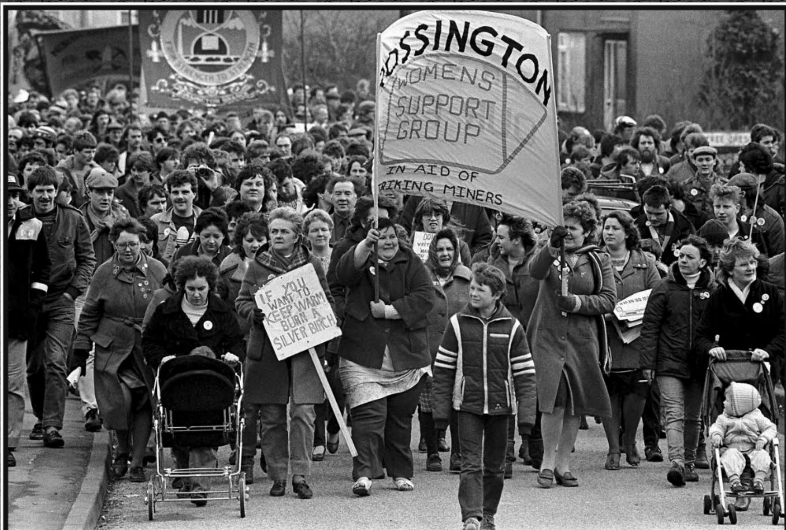
THE END: Miners' support group leads a demonstration of strikers at Rossington pit village before the return to work after the miners had decided to end their year-long strike.