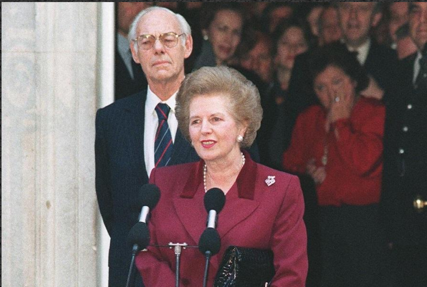
отставка Маргарет Тэтчер 1990 г.