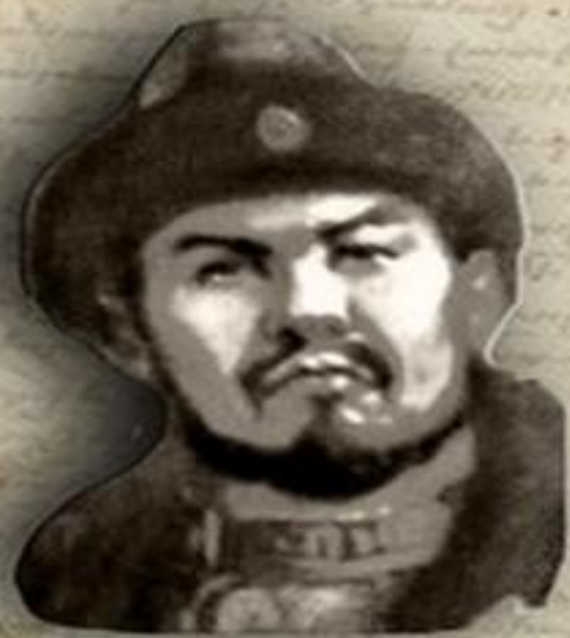
(1445 – 1518) «ҚАСҚА ЖОЛЫ» (СВЕТЛЫЙ ПУТЬ) ҚАСЫМ ХАН