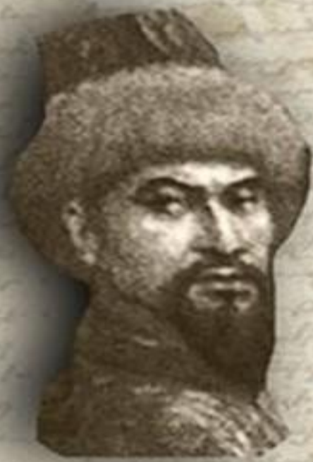
(1626 – 1718) «ЖЕТИ ЖАРҒЫ» (СЕМЬ ЗАКОНОВ) ТӘУКЕ ХАН