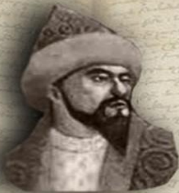
(1598 — 1628) «ЕСКІ ЖОЛЫ» (ДРЕВНИЙ ПУТЬ) ЕСИМ ХАН