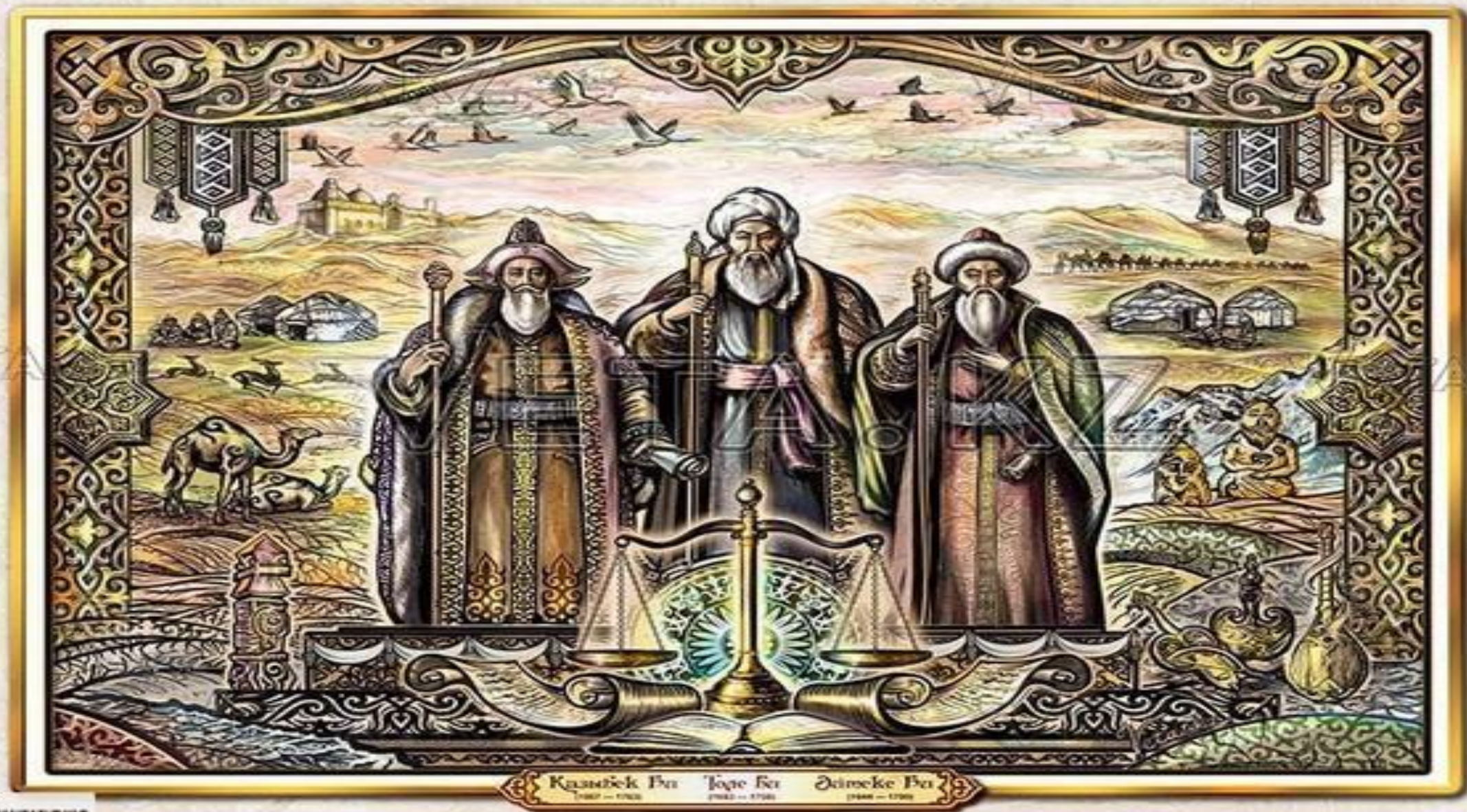
Каспий Бей (1707 – 1752) Тоқай Бей (1702 – 1750) Дәірмеке Бей (1688 – 1750)