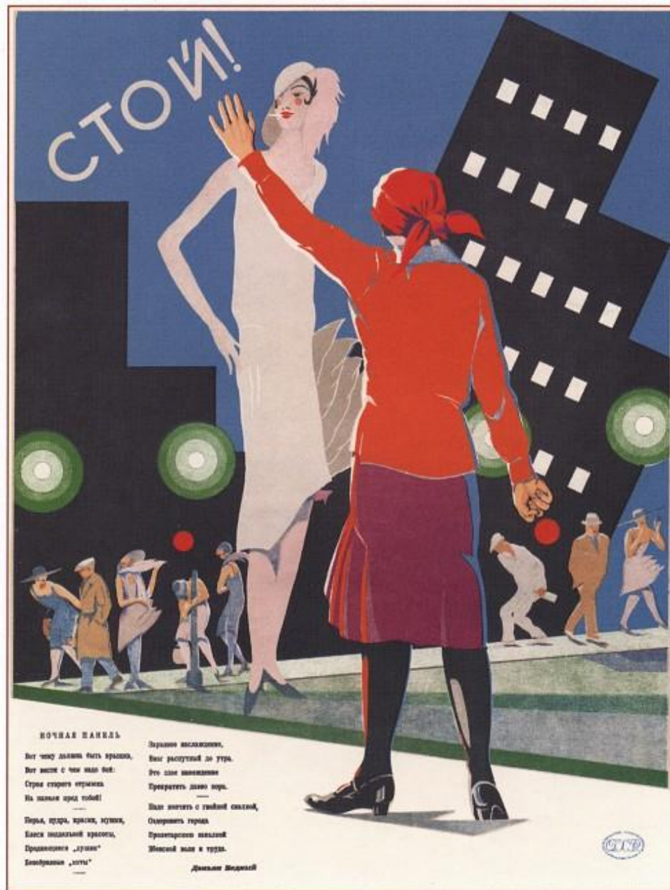
425. Неизвестный художник Стой! Ночная панель. 1929