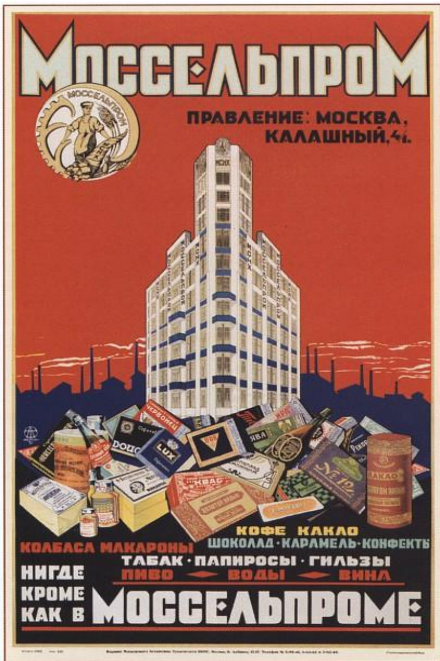
520. Тархов Д. Моссельпром. 1926