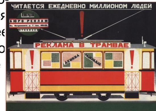
195. Буланов Д. Реклама в трамвае... 1927

В Данный период тематика плакатов сменяется с военно-политической тематики, на потребительскую, появляются рекламные плакаты. Текста и картинки становятся более разнообразными. Исчезает тема буржуазии и классового неравенства, на их место приходят более нейтральные темы потребления, образования мелких социальных проблем.