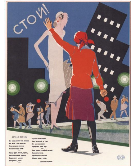
425. Неизвестный художник Стой! Ночная панель. 1929

В Данный период тематика плакатов сменяется с военно-политической тематики, на потребительскую, появляются рекламные плакаты. Текста и картинки становятся более разнообразными. Исчезает тема буржуазии и классового неравенства, на их место приходят более нейтральные темы потребления, образования мелких социальных проблем.