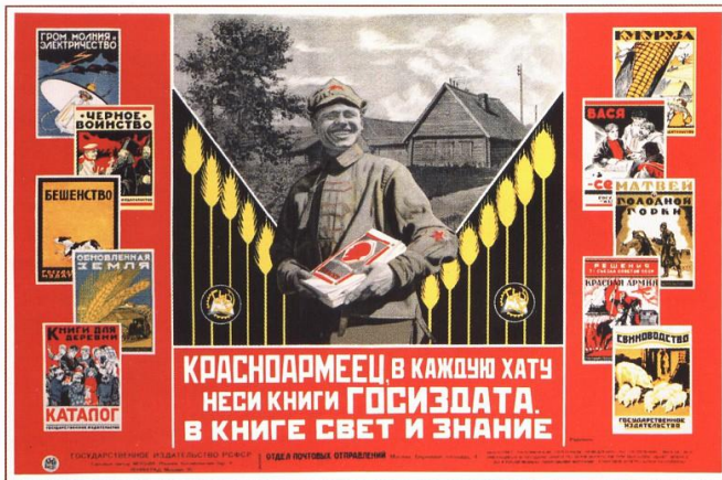
175. Родченко А. Красноармеец, в каждую хату носи книги Госиздата. 1925