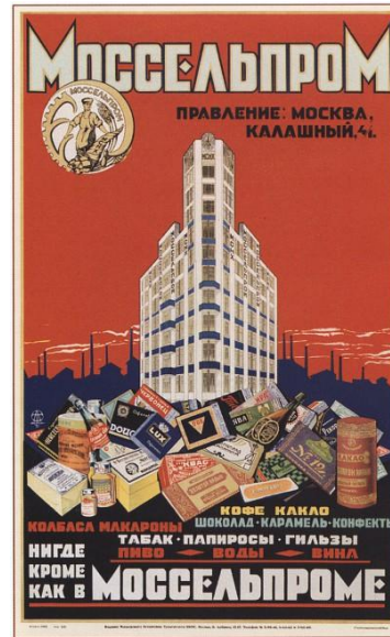
520. Тархов Д. Моссельпром. 1926