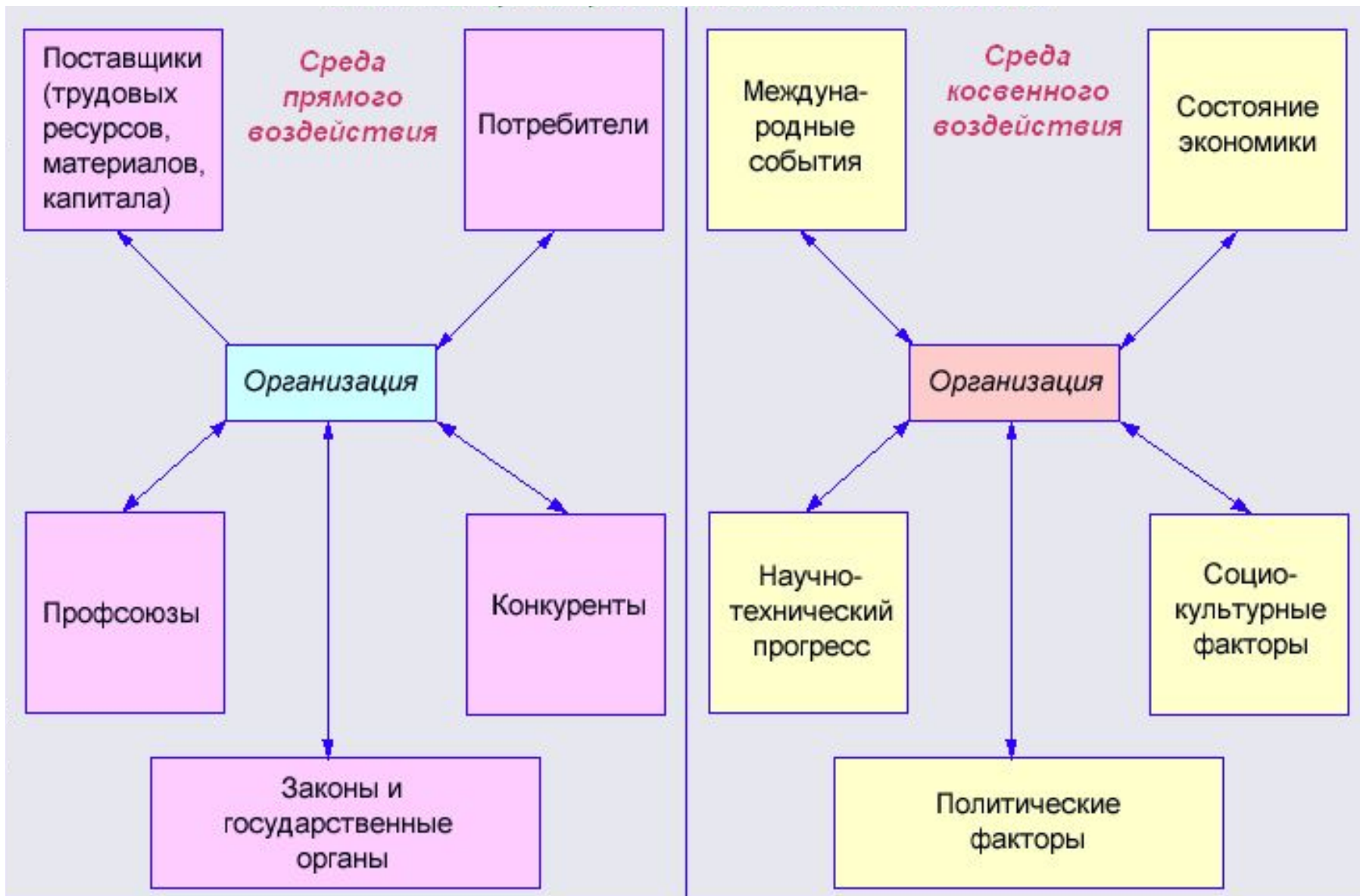
Рисунок 3.3 – Элементы внешней среды прямого и косвенного воздействия