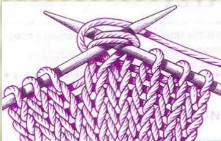
Убавки по две петли вместе