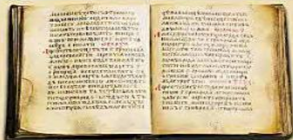
Русская правда. Рукопись XIV в.

Русская Правда Старейший древнерусский свод законов — Русская 'Правда. Этот документ создавался на протяжении XI—XII веков. Начало ему около 1016 года положил Ярослав Мудрый (это прозвище появилось в исторической литературе в XIX веке). Во второй половине XI века сыновья Ярослава дополнили Русскую Правду новыми законами.