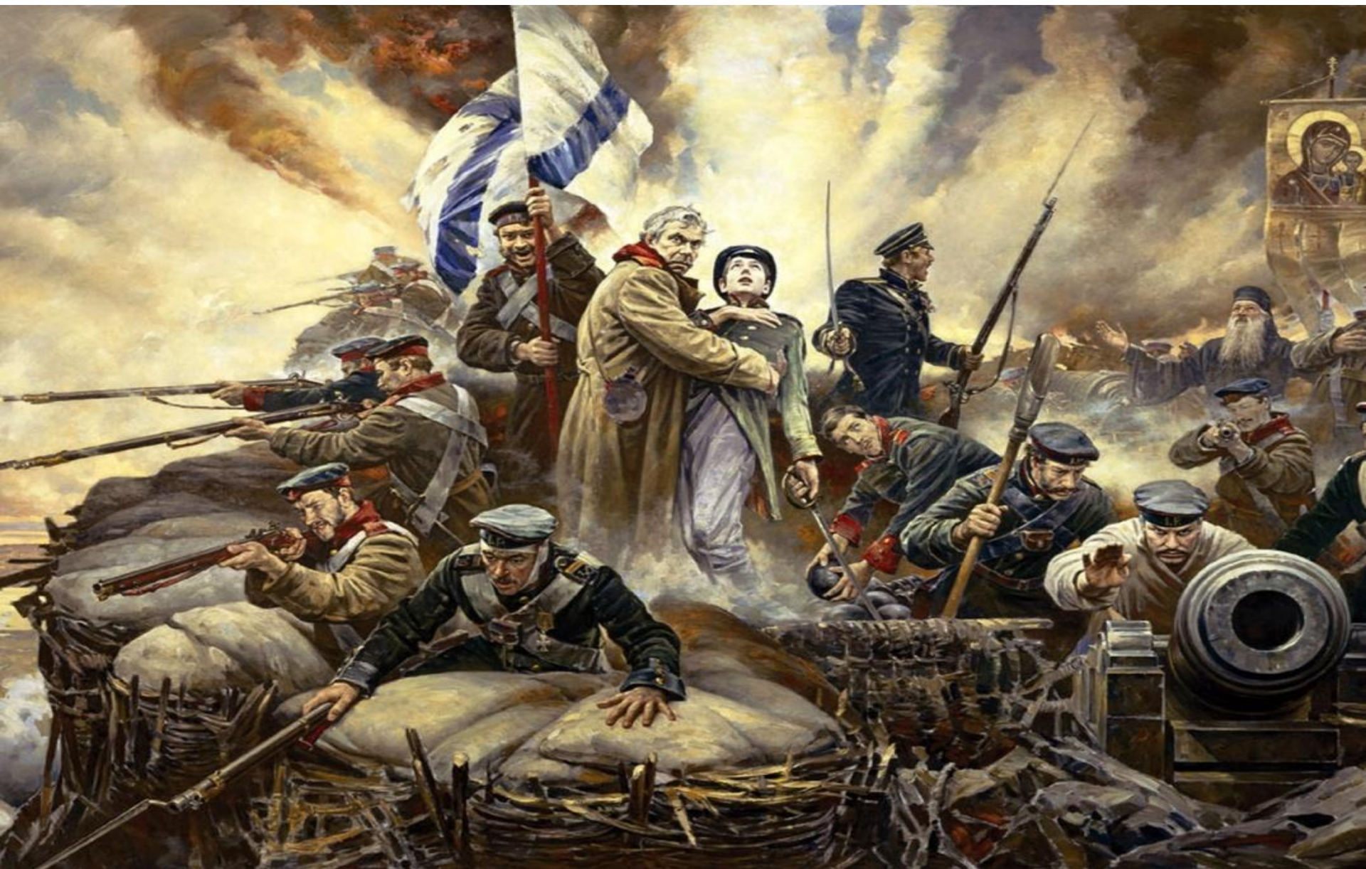
Оборона Севастополя 1854 год