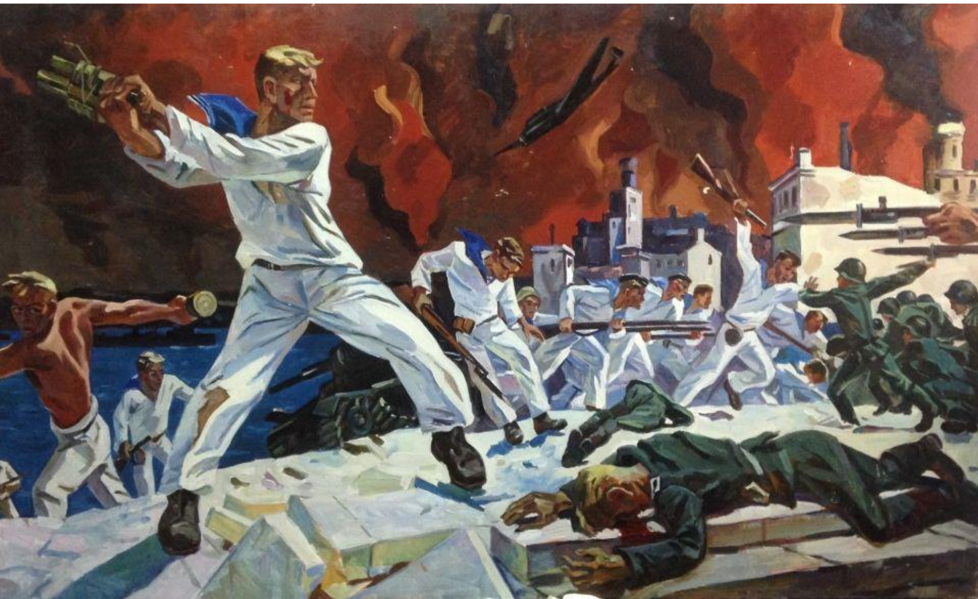
Оборона Севастополя 1941 г.