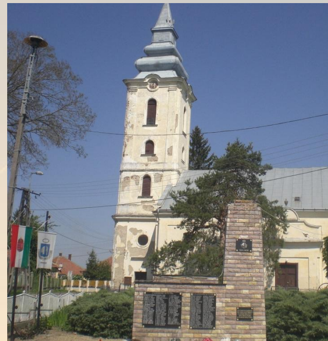
Место захоронения: площадь деревни Ванчед (Венгрия), 30 апреля 2012 года

Посмертно награжден орденом «Отечественной войны второй степени».